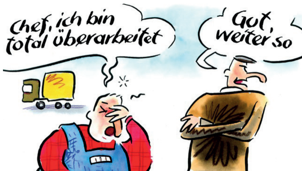
Abbildung: Karikatur – IG BCE Landesbezirk Hessen-Thüringen

Diese extern gestützten Antrieber der Leistungsethik stehen in direkter, auch innerer, Konkurrenz zum gleichermaßen notwendigen Bedürfnis nach Abgrenzung und Muße. Ein Selbstmanagementkonzept ist damit stets in Gefahr, durch das externe Übergewicht von „Anerkennung durch Leistung“ aus dem Gleichgewicht zu geraten. Hinzu kommt, dass derartige innere Aushandlungsprozesse weit weniger bewusst ablaufen, als es die einschlägigen Modelle nahelegen. Tatsächlich sind unsere Verhaltensmuster biographisch erworbene und tief in unser Körpergedächtnis eingeschriebene Skripte, die über Gehirnregionen gesteuert werden, die weiter von Vernunft und Rationalität entfernt sind, als wir uns eingestehen. 17 Es ist eine Haltung zu sich und der Welt, die sich nur sehr begrenzt durch Einsicht verändern lässt. Vielmehr braucht es ein auch körperbetontes Training in Kombination mit kontinuierlich wiederkehrendem Feedback, damit erweiterte Handlungsspielräume der Selbststeuerung aufgebaut werden. 18