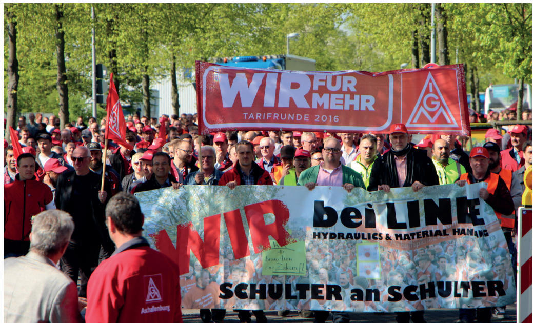
Abbildung: Arbeitskampf in der Öffentlichkeit – IG Metall, Aschaffenburg

In Deutschland existiert eine Tarifautonomie , die historisch einzuordnen ist. Der Staat als übergeordnete politische Ordnungseinheit sieht es traditionell nicht als seine Aufgabe an, konkrete Lohn- und Arbeitsbedingungen festzusetzen. Dies geschieht nur in Ausnahmefällen in jüngster Zeit, etwa wenn gesetzlich ein Mindestlohn festgelegt wird – welcher an und für sich dem Prinzip der Tarifautonomie widerspricht.