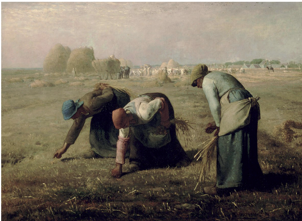
Abbildung.: Arbeit in der Landwirtschaft als für die direkte Gewinnung des Lebensunterhalts erforderliche Tätigkeit – Jean-François MILLET, „Die Ährenleserinnen“, 1857

In der Antike lässt sich eine Selbstverständlichkeit und Omnipräsenz der Arbeit konstatieren. Arbeit war die Tätigkeit, die in der Landwirtschaft für die direkte Gewinnung der für den Lebensunterhalt nötigen Ressourcen, speziell der Lebensmittel, erforderlich war. Auch die Ausübung von Handwerksberufen, etwa in der Bauwirtschaft etc., wurden als Arbeit verstanden. Das ständige Arbeiten über den ganzen Tag – außer am Feiertag – wurde als gottgegeben angesehen: „Solange die Erde steht, soll nicht aufhören Saat und Ernte, Frost und Hitze, Sommer und Winter, Tag und Nacht.“ (1. Mose 8, 22).