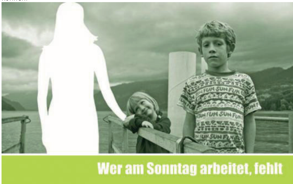
Abbildung: Anzeige und Plakat zur Sonntagsarbeit – Schweizerischer Evangelischer Kirchenbund

Der Rhythmus der 7-Tage-Woche kennt am letzten Tag (dem Sabbat – das ist heute der Samstag) ein absolutes Arbeitsverbot. Diese Debatte hat sich mittlerweile vom Sabbat-Samstag auf den (christlichen) Sonntag als Ruhetag verschoben. Während kaum jemand die generelle Notwendigkeit von Ruhetagen und Arbeitspausen bestreiten wird, ist aktuell die Frage in der Diskussion, ob dieser Ruhetag in der Woche beliebig verschoben werden kann, im Sinne einer Flexibilisierung der Arbeitszeit. Es darf nicht verkannt werden, dass eine normale „Kollegialität“ und eine sinnvolle Erholung im privaten Bereich natürlich davon abhängen, dass Pausen und Ruhetage zumindest anteilig gemeinsam in einem sozialen Kontext begangen werden können.