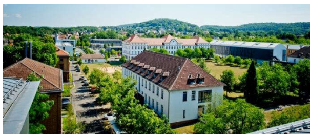
Fig. 5 Campus der TH Aschaffenburg ( www.th-ab.de ).

Die 1995 als Fachhochschule gegründete TH Aschaffenburg ist eine aufstrebende Hochschule am Rande der Metropolregion Frankfurt-Rhein-Main mit derzeit über 3.200 Studierenden. Sie zeichnet sich durch wirtschaftsnahe, überwiegend interdisziplinäre und innovative Studiengänge aus [4]. Forschungsgebiete an der Fakultät Ingenieurwissenschaften der TH Aschaffenburg sind dabei u.a. auch Beschichtungen für Röntgenspiegel und die Röntgenastronomie [5].