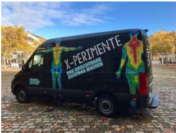
Fig. 1 Foto des „X-perimente“ – Mobils.

Die Entdeckung der Röntgenstrahlung jährt sich in diesem Jahr zum 125. Mal. Gleichzeitig würde ihr Entdecker Wilhelm Conrad Röntgen, der erste Physik-Nobelpreisträger, im Röntgenjahr 2020 seinen 175. Geburtstag feiern. Unter dem Motto „Das Unsichtbare sichtbar machen“ haben sich für das Röntgen-Jubiläumsjahr 2020 das Deutsche Röntgen-Museum in Remscheid und die Reiss-Engelhorn-Museen in Mannheim die Aufgabe gestellt, mit einem Experimentiermobil (Abb. 1) Kindern und Jugendlichen die Möglichkeit zu geben, den bedeutenden deutschen Physiker und Entdecker näher kennenzulernen [1].