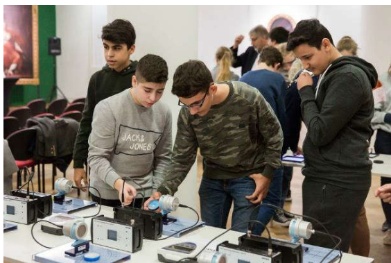
Fig. 3 Messung der natürlichen Radioaktivität als „X-perimente“-Versuch zur Gammastrahlung.

Im Jahr 2020 begeht Deutschland das Röntgen-Jubiläumsjahr und feiert damit die Entdeckung der Röntgenstrahlen vor 125 Jahren und zugleich den 175. Geburtstag ihres Entdeckers Wilhelm Conrad Röntgen, dem ersten Physik-Nobelpreisträger. Finanziert durch eine Förderung der Klaus Tschira Stiftung entwickelten die Reiss-Engelhorn-Museen in Mannheim und das Deutsche Röntgen-Museum in Remscheid hierzu ein mobiles Lernlabor mit interaktiven Experimenten für Kinder und Jugendliche (Abbildung 1). Unter dem Motto "X-perimente – Das Unsichtbare sichtbar machen" sollte diese Forschungsstation mit Experimenten zur Messung und Analyse unterschiedlicher Strahlungen im Jubiläumsjahr 2020 deutschlandweit unterwegs sein und den Nachwuchs für Naturwissenschaften und Technik begeistern [1].