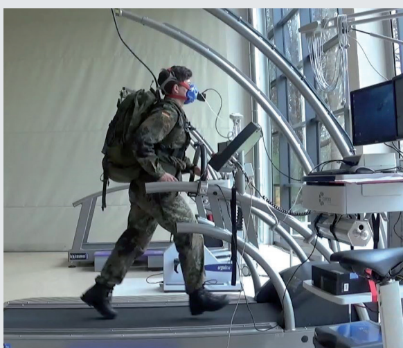
Abb. 1: Probandin während der Laufbanduntersuchung mit einer Zusatzlast von 30 % ihres Körpergewichts (Genehmigung zur Veröffentlichung liegt vor)

Die geschlechtsspezifische Betrachtung der Ausgangswerte vor Belastungsbeginn (Tabelle 2) bestätigte die Annahme, dass das Heben von Zusatzlasten bis zu 30 % des individuellen Körpergewichts nicht zu einer Erhöhung der Beanspruchung führt. Mit 50 % Zusatzlast kommt es jedoch bereits vor Beginn der Belastung zu einer Erhöhung der Beanspruchung, die eine Erhöhung der kardio-pulmonalen Parameter um 12 % bewirkt, so dass empfohlen werden kann, hohe Zusatzlasten in Pausen oder Standphasen abzusetzen [9].