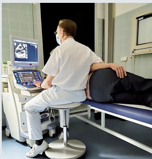
Abb. 2: Echokardiographie im Rahmen der erweiterten Covid-Nachuntersuchung

Eine Infektion mit dem SARS-CoV-2-Erreger kann eine breite Varianz der Symptomatik nach sich ziehen, von