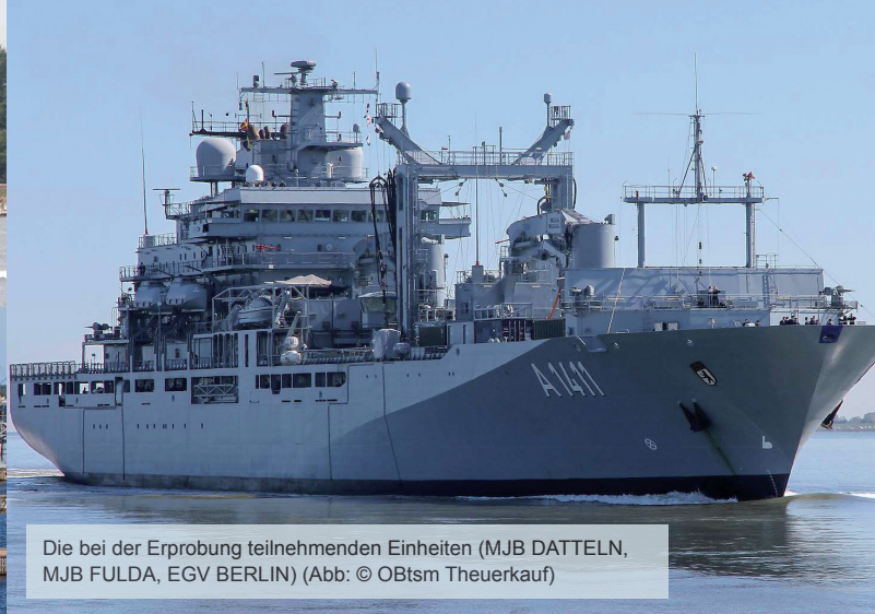
Die bei der Erprobung teilnehmenden Einheiten (MJB DATTELN, MJB FULDA, EGV BERLIN)