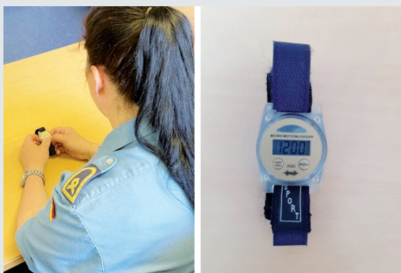
Abb. 3: Durchführung des Psychomotor Vigilance Tests (links). Das rechte Bild zeigt den Aktigraphen der Firma Motionlogger® Micro Watches (Ambulatory Monitoring, Inc.)

Fatigue Severity Scale [7]). Die Vigilanz, also die Fähigkeit, einen zu einem unbekanntem Zeitpunkt erscheinenden Stimulus zuverlässig zu entdecken und schnell auf diesen zu reagieren, wurde mittels des Psychomotor Vigilance Tests erhoben. Dieser war auf den Aktigraphen programmiert, den die Teilnehmenden im Datenerhebungszeitraum trugen. Der dreiminütige Aufmerksamkeitstest war jeweils zu Wachbeginn und -ende (also viermal am Tag) durchzuführen. Hierbei war der Aktigraph abzulegen und in die Hände zu nehmen. Sobald ein Signal auf dem Display erschien, musste so schnell wie möglich eine Taste auf dem Aktigraphen gedrückt werden (Abbildung 3).