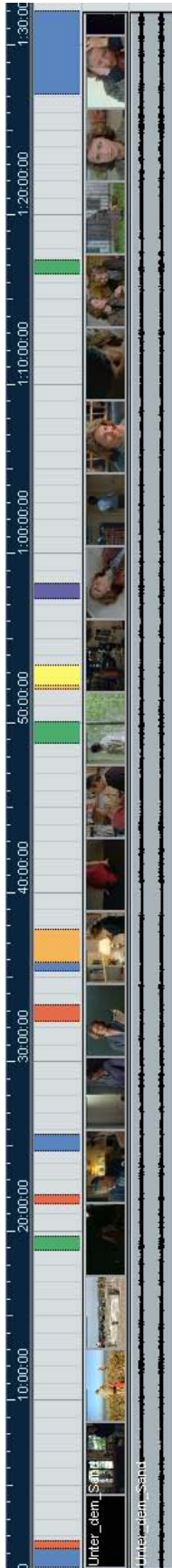
Sous le Sable – Überblick über den Gesamtfilm