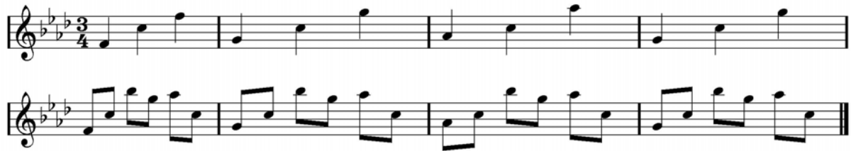
Abbildung 2: Die Begleitstimme der Harfe bei den Wiedersehen

tiefe Streicher. Komposition und Instrumentation sind auf eine große Durchsichtigkeit hin angelegt.