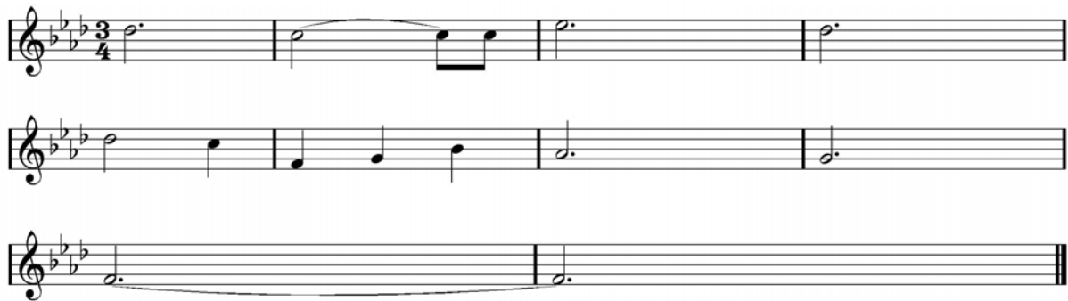
Abbildung 1: Das Hauptthema aus „Unter dem Sand“

Im Hauptthema überwiegen die langen Notenwerte. Die ersten vier Takte hinterlassen so, wie sie das zweigestrichene D umkreisen, einen statischen Eindruck, erst in der zweiten Hälfte des Themas kommt mehr Bewegung auf. Gleichzeitig bringt letztere eine kadenzierende Harmonik. Über die Dur-Dominate (C-Dur) in Takt 5 und dem verminderten Septakkord auf der zweiten Stufe mit Nonenvorhalt in Takt 7, welcher sich in Takt 8 auflöst, geht es zurück zur Tonika f-Moll. Interessanterweise fehlt dem verminderten Septakkord seine verminderte Quinte, was die Deutung als Dominantseptnonenakkord erschwert, da in diesem dann die leittönige Terz fehlen würde. Die Taktart ist nun eindeutig als \frac{3}{4} zu identifizieren, das Tempo mit ungefähr 81 Schlägen pro Minuten ein wenig getragen, aber nicht schleppend, zusammen erzielen sie eine feierliche Wirkung, die die wundersame Grundstimmung noch verstärkt.