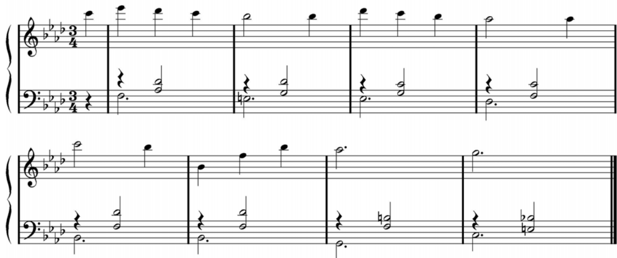
Abbildung 3: Das Nebenthema aus der Abspannmusik

Diese Stelle ist die persönlichste und intimste in Rhombis Musik zu „Unter dem Sand“. Sie erinnert in ihrem Gestus an Kammermusik der Romantik. In der eröffnenden viertaktigen Einleitung im Klavier begleitet die linke Hand in gebrochenen Akkorden die rechte mit ihren Fragmenten des Hauptthemas, bevor dieses in voller Gestalt im Solo-Cello erklingt und sich das Klavier auf die Aufgabe der Begleitung konzentriert. Ab Takt 13 führt das Klavier allein fort, indem es sich wieder selbst begleitend das Material des Hauptthemas motivisch weiterspinnt. Erst ab Takt 23 erscheint ein deutlich erkennbar neuer thematischer Gedanke.