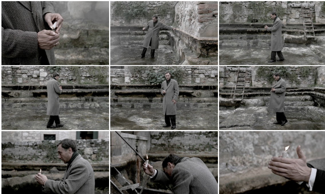
Dar. 5–13: Standbilder aus Nostalghia 53

Als Beispiel für Tarkowskis Umgang mit der Zeit wähle ich eine Szene aus seinem vorletzten Film Nostalghia (siehe Darstellungen 5–13). Sie ist neun Minuten und sechs Sekunden lang und damit eine der längsten Einstellungen seiner Filme. Die Prämisse ist simpel: Die Figur des Andrei muss eine brennende Kerze in einem leeren, dampfenden Thermalbad von der einen auf die andere Seite tragen und die brennende Kerze dort abstellen. Immer wenn die Kerze ausgeht, muss Andrei wieder von vorne anfangen.