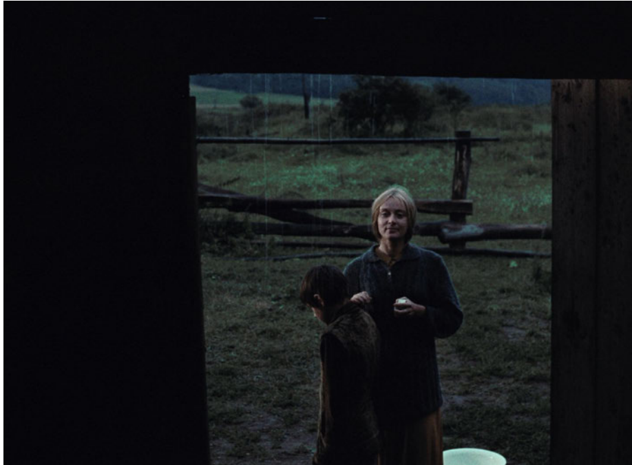
Dar. 1: Standbild aus Der Spiegel 1

Auf der Suche nach einem Bild, das ich als Beispiel für poetische Bildgestaltung zeigen will, bin ich bei diesem hängen geblieben (siehe Darstellung 1). Es ist aus Tarkowskis viertem Film Der Spiegel . Auch als ich danach noch weiter gesucht habe, nach anderen poetischen Bildern aus seinen Filmen, blieb es in meinem Kopf hängen.