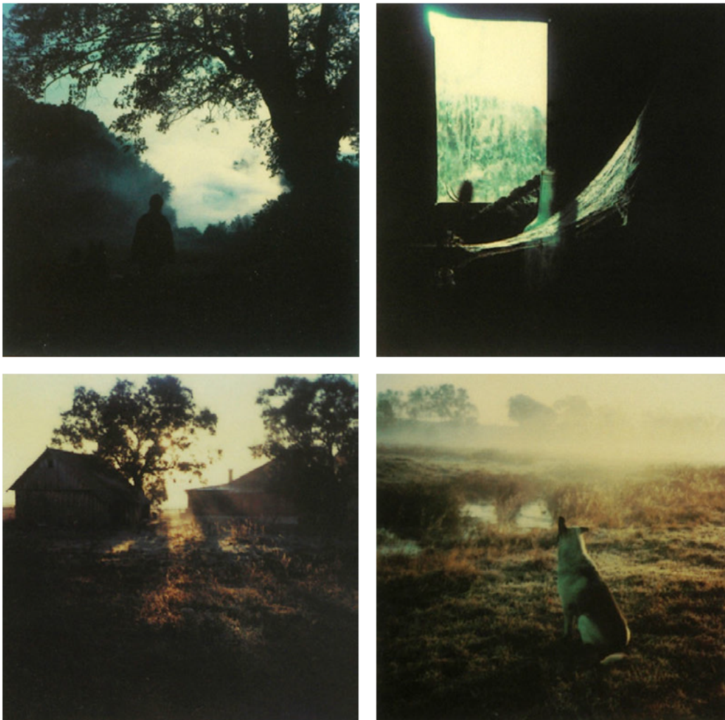
Dar. 33–36: Tarkowskis Polaroids 79

Tarkowski bekommt von Regisseur Michelangelo Antonioni 1977 eine Polaroidkamera geschenkt. 77 Er findet viel Freude an dieser Kamera und hält damit seine letzten Tage in Russland fest, sowie sein Leben im Exil in Italien bis zum seinem Tod 1986. 78 Seine besondere Art der Bildsprache ist in den Aufnahmen deutlich zu erkennen. Tarkowski hat fast 200 Polaroids zwischen 1979 und 1983 aufgenommen. 60 davon sind posthum veröffentlicht worden. Ich betrachte diese Polaroids als eine persönliche Skizzensammlung: Die Bilder sind seltene visuelle Einblicke in seine Art zu denken. Damit ist im Vergleich zu Literatur oder Interviews ein direkter Blick durch seine Augen möglich, um die vielzitierten inneren Bilder am Ort der Entstehung zu sehen. Sie zeigen mir, dass die Bildgestaltung seiner Filme in höchstem Maße seine eigene poetische Art in Bildern zu denken ist.