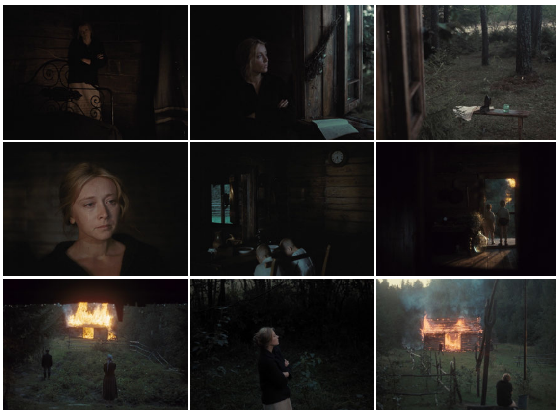
Dar. 14–22: Standbilder aus Der Spiegel 57

Als Beispiel für Tarkowskis Inspiration durch Träume und Erinnerungen werde ich im Folgenden die dritte Szene aus dem Film Der Spiegel analysieren (siehe Darstellungen 14–22).