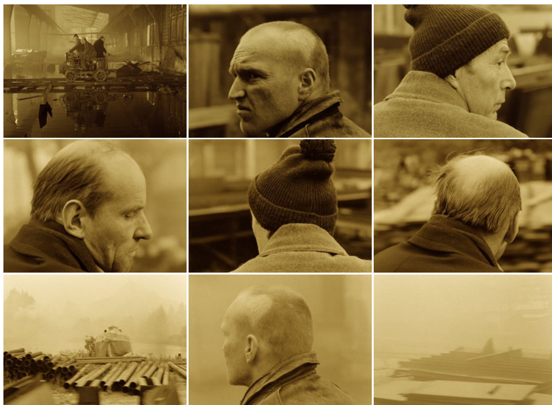
Dar. 24–32: Standbilder aus Stalker 66

Figuren. In der drei Minuten und vierzig Sekunden langen Szene ist die Kamera immer mit auf der fahrenden Draisine, es gibt keine Einstellung von außen. Sie ist sehr nah an ihnen, der Hintergrund ist unscharf, an manchen Stellen ist der Fokus nach hinten auf verlassene Industriegebiete gelegt. Die Kamera befindet sich seitlich oder hinter den Figuren. Die Perspektive auf die Hinterköpfe führt für mich dazu, dass ich das Gefühl bekomme, in den Kopf der Figuren einzutauchen. 65