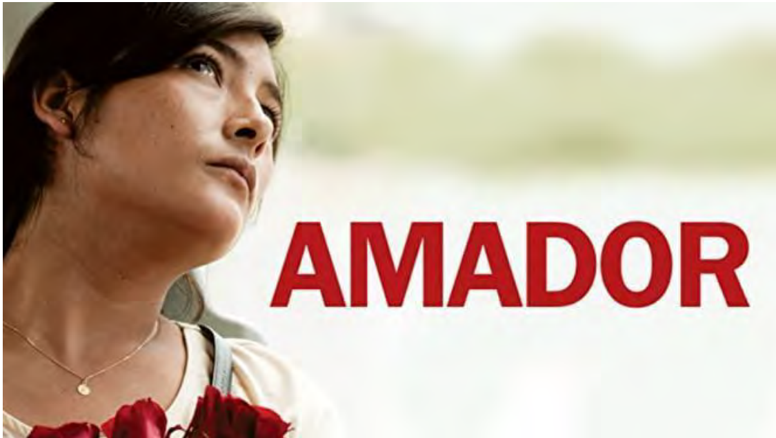
Abb. 01: Cover: AMADOR.

Amador erzählt vom Leben von Marcela, einer peruanischen Migrantin mit illegalem Status in Madrid, die ökonomische Schwierigkeiten hat und zur Care-Arbeiterin von Amador, einem bettlägerigen alten Mann, wird, um ihren Partner, Nelson, finanziell zu unterstützen.