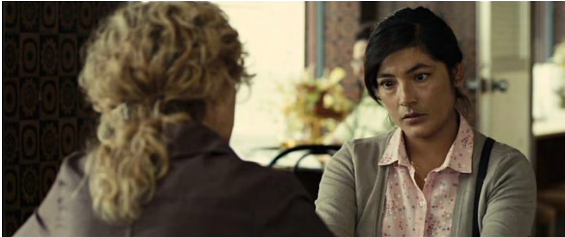
Abb. 05: Still: AMADOR. Min.:00:11:50