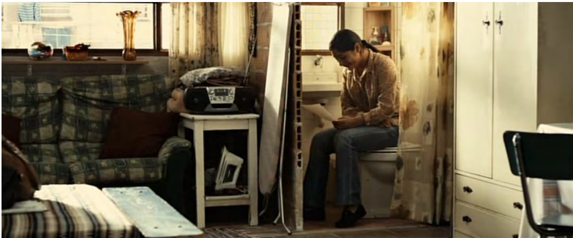
Abb. 09: Still: AMADOR. Min.:00:03:59

Nelson: Die Verkäufer müssen reinkommen. Ich kann nicht auf der Straße verkaufen.