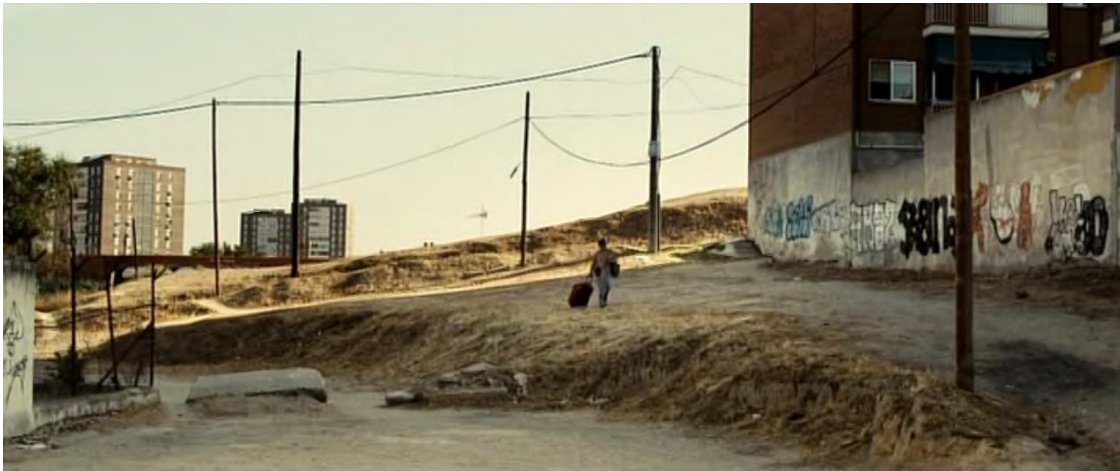
Abb. 10: Still: AMADOR. Min.:00:06:17