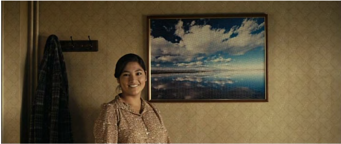
Abb. 06: Still: AMADOR. Min.:01:41:10