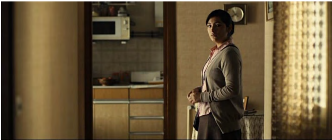
Abb. 02: Still: AMADOR. Min.:00:13:36

Auf der Ebene der äußeren Erscheinung ermöglicht zunächst Marcelas Kleidung und Frisur, auf ihren Status und ihre Weltsicht zu schließen. Ihre schlichte Kleidung, die vor allem aus geschlossenen Oberteilen, Pullovern, knielangen Röcken (TC 00:13:36-00:13:40) oder Hosen besteht, sowie ihre oft nach hinten gebundenen langen glatten Haaren, sind Ausdruck ihres zurückhaltenden Wesens.