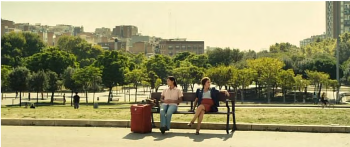
Abb. 03: Still: AMADOR. Min.:01:43:02