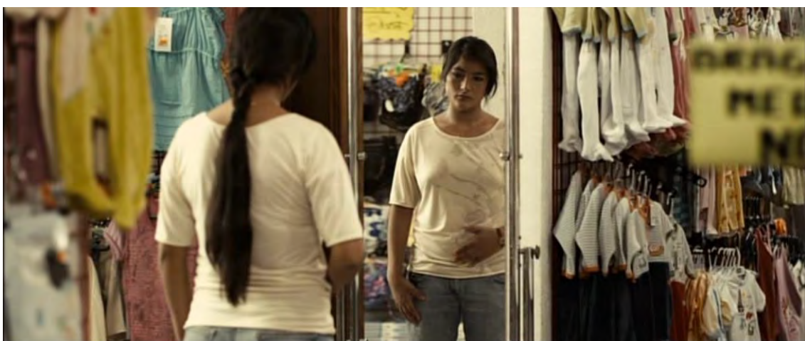
Abb. 04: Still: AMADOR. Min.:00:20:36