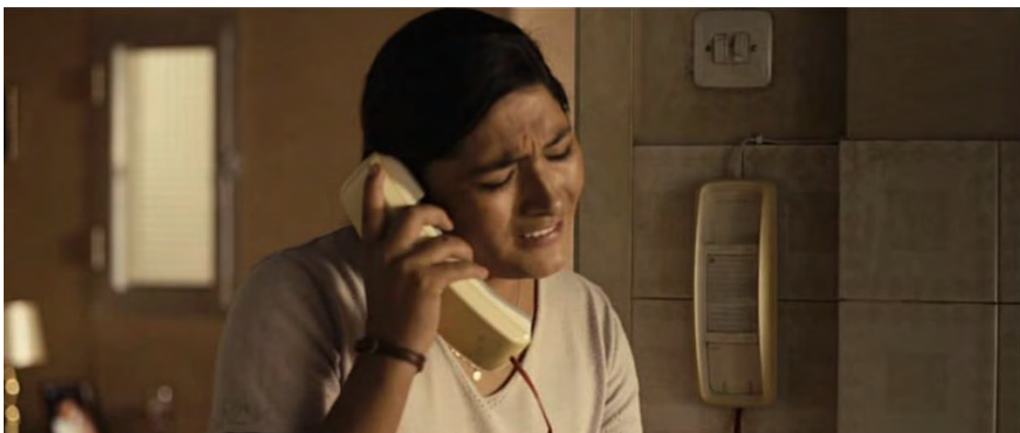
Abb. 07: Still: AMADOR. Min.:00:46:29

Auch ihre Körperhaltung spiegelt diese Spannung wider. Zu Beginn des Films ist Marcela sitzend mit gesenktem Kopf zu sehen, als sie weinend ihren Trennungsbrief für Nelson liest (TC 00:03:55-00:04:13). Ihr innerer Zustand manifestiert sich noch stärker in ihrer Körperhaltung, als sie nach dem Tod von Amador mit Yolanda telefoniert und – aufgrund ihrer moralischen Skrupel nur unter größten Mühen – so tut, als sei alles in Ordnung. Während es ihr mit ihren Worten gelingt, Yolanda zu täuschen, verraten ihr immer weiter zusammengekrümmter und zitternder Körper und ihre Mimik dem Publikum ihr Leiden (TC 00:45:55-00:46 :40).