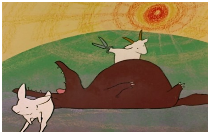
Abbildung 6: Animierte Kinderzeichnung als innere Bilder, Heidi , Ep. 25, T.: 21:22. Zuiyo Eizo

Aber besonders der Wechsel in einen reduzierten, naiven Zeichenstil (vgl. Abb. 6), der tatsächlich an Kinderzeichnungen aus dem Kindergartenalter erinnert, markiert die Bilder als Heidis innere Bilder. Obwohl Heidi in ihrer Vorstellung schon früher ‚animiert‘ oder ‚gezeichnet‘ hat, wurde dabei nie der Animationsstandard gewechselt.