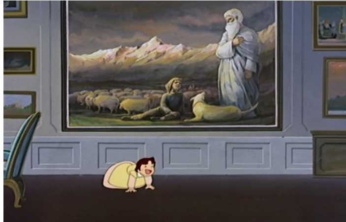
Abbildung 5: Bergpanorama mit altem Heiligen und jungem Hirten, Heidi , Ep. 32, T.: 11:04. Zuiyo Eizo