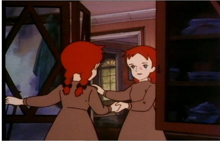
Abb. 1: Anne und ihre imaginierte Doppelgängerin, Anne mit den roten Haaren , Ep. 6, T.: 17:34. Nippon Animation

Aber nicht nur ihr Spiegelbild sieht sie als Freundin, sondern Anne gibt auch sich selbst immer wieder eine andere Persona und damit eine Art Schutzidentität: „Lady Cordelia“, wie Anne sich im Spiel oft nennt, sind die traumatischen Erfahrungen des Waisenkind Annes nie zugestoßen, sie hat ihre Würde und Freude am Leben noch – deshalb besitzt Anne sie ebenfalls (z.B. Anne , Ep. 2, T.: 10:12–11:14). Immer wieder wird die Fantasie als Traumabewältigungsstrategie und Resilienzmechanismus herangezogen – hier stellt sie beispielsweise den Faktor Selbstwertgefühl ( self esteem ) wieder her (siehe 2.4.2). Imagination ist eine mächtige Ressource bei Takahata, die auch bei Heidi eine Rolle spielen wird.