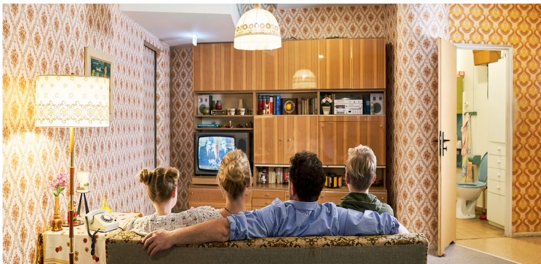
Abb. 3/4 und 5: Wohnzimmer der STADT UND LAND Museumswohnung (oben) und des DDR Museum (unten) im Vergleich.