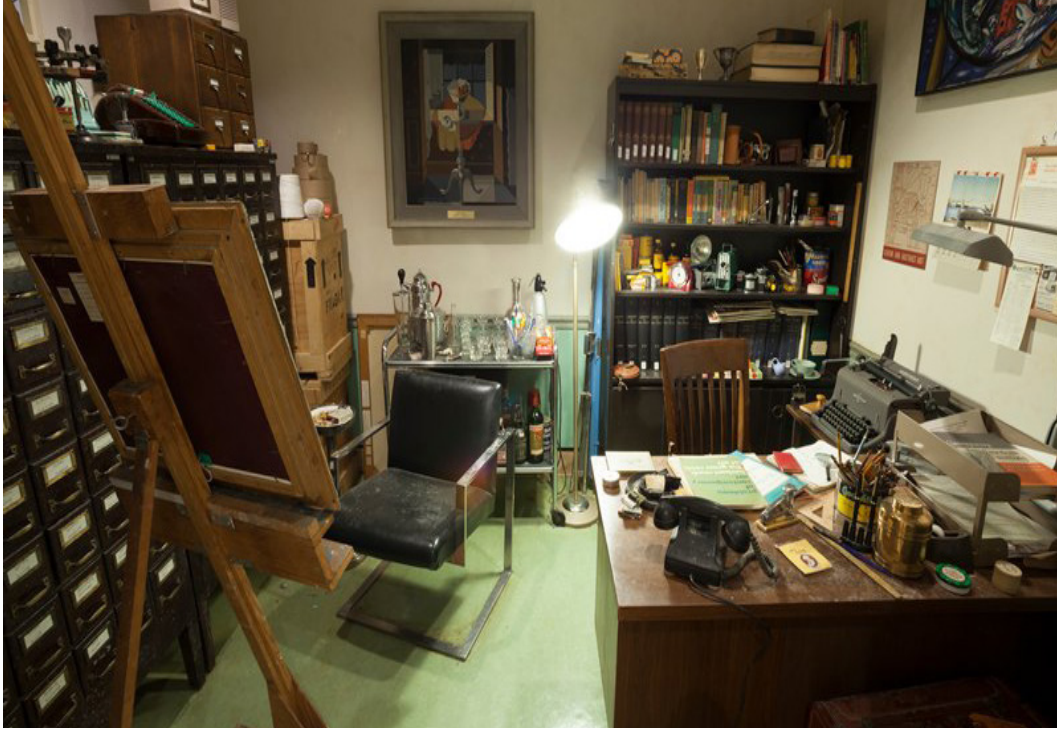
Abb. 15: Installationsansicht vom Curators Office (2012-2013) des Künstlers Mark Dion im Minneapolis Institute of Art, Minneapolis, Minnesota.

rell bedingte sowie zeit- und ortsgebundene Tätigkeit ist, wie entscheidend die Umgebung und die jeweils gegenwärtige Perspektive der Kurator:innen für dieselbe ist.