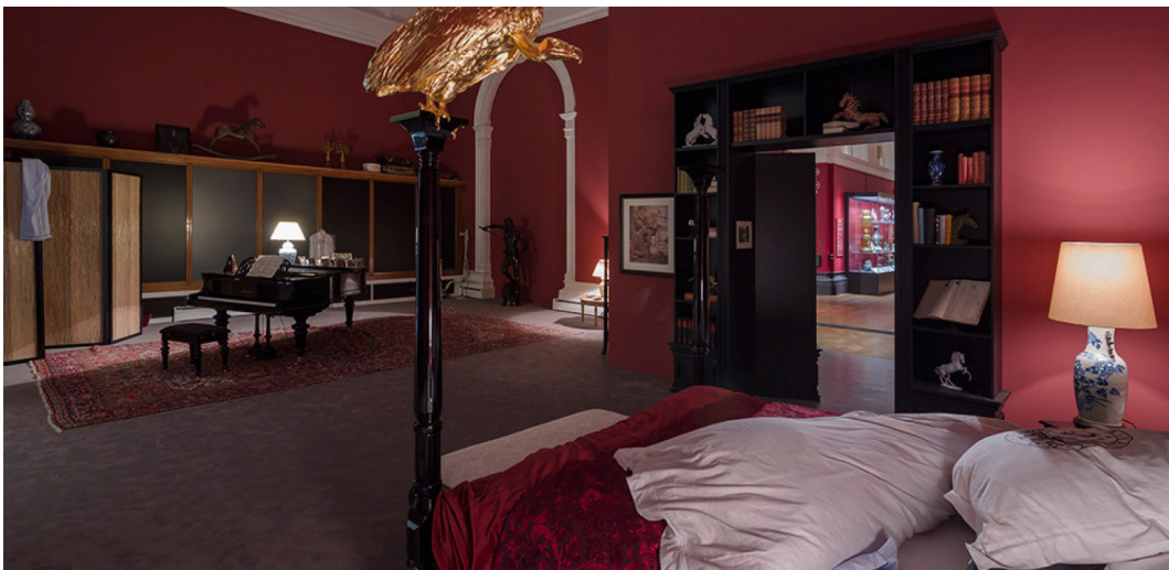
Abb. 16/17: Installationsansichten von Tomorrow (2013-2014) der Künstler:innen Michael Elmgreen und Ingar Dragset im Victoria und Albert Museum, London.

Im Gegensatz zu den vorangegangenen Installationen, die mit Repros und Fälschungen arbeiten, stammen die Einrichtungsgegenstände vornehmlich von Flohmärkten und wurden von dem Künstlerduo selbst ausgewählt und gesammelt. Wirkungsstrategisch entsteht