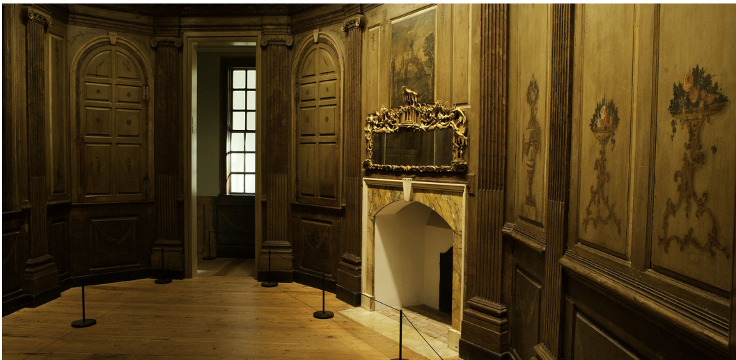
Abb. 1: Ausstellungsansicht des Marmion Room, Metropolitan Museum of Art, New York.

Fenster sind mit kaltem, passivem Licht hinterleuchtet, um die Illusion von Tageslicht zu erzeugen. 116 Und auch an der weißen, untapezierten Decke ist passives Licht installiert, sodass der Raum zwar ausgeleuchtet ist, die Wandmalereien aber zugleich konservatorisch geschützt werden. Im Raum befinden sich keinerlei Texttafeln oder Labels, sodass die Informationen zur Beschaffenheit und Geschichte des Raumes nur via Audioguide, Führung oder auf der Website des Museums erhalten werden können. Letztere stellt dabei umfangreiche Informationen sowie Fotografien zur Verfügung, sodass selbst die mehrmaligen Umzüge des Raumes innerhalb des Hauses sowie die über die Jahrzehnte durchgeführten Restaurierungsprozesse, beispielsweise des Spiegelbehangs, transparent gemacht werden. 117