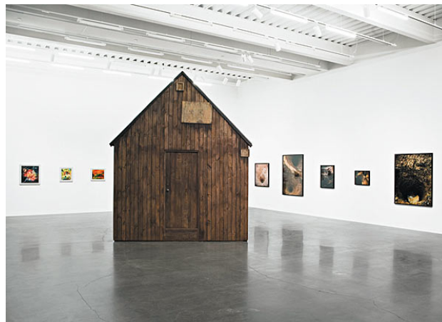
Abb. 10: Installationsansicht von Unacabine (2009) des Künstlers Robert Kusmirowski im New Museum of Contemporary Art, New York.

Da Shonibares Oeuvre bereits beleuchtet wurde, sollen nun Arbeiten des polnischen Künstlers Robert Kusmirowski zur Veranschaulichung der Gruppe der »gefälschten« Period Rooms herangezogen werden. Dieser nutzt die Techniken des Kopierens und Imitierens, um über die Konstruktion des kulturellen Gedächtnisses mittels Memorabilia, deren Materialität und über die Neigung zur vor allem in der westlichen Welt verbreiteten fetischistischen Überhöhung derselben zu reflektieren. Bei Unacabine (2008) handelt es sich um eine für den Künstler typische raumgreifende Installation, die er erstmals im New Museum of Contemporary Art in New York aufgebaut hat. 139 Dabei rekonstruierte er die Holzhütte, in der sich der Terrorist Theodore Kaczynski in Montana versteckte, um seine Briefbombenangriffe auf US-amerikanische Firmen, Fluggesellschaften und Universitäten zu planen. Im großen weißen Galerieraum wurde die maßstabsgetreue Nachbildung der Hütte platziert und dadurch verfremdet, verweist doch die künstlich erzeugte Patina des Holzes auf ihren angeblichen Standort in der Wildnis.