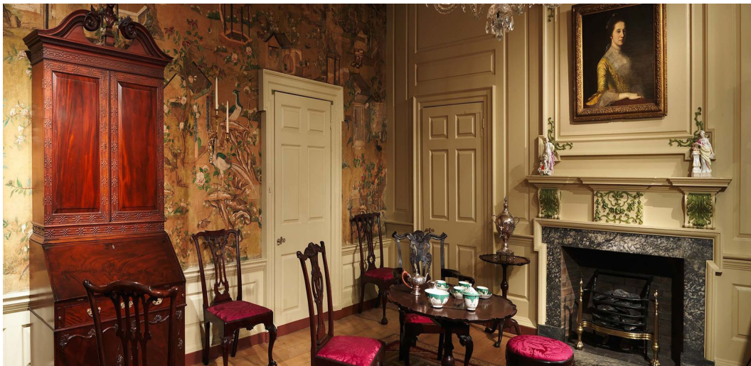
Abb. 2: Ausstellungsansicht des Powel Room, Metropolitan Museum of Art, New York.