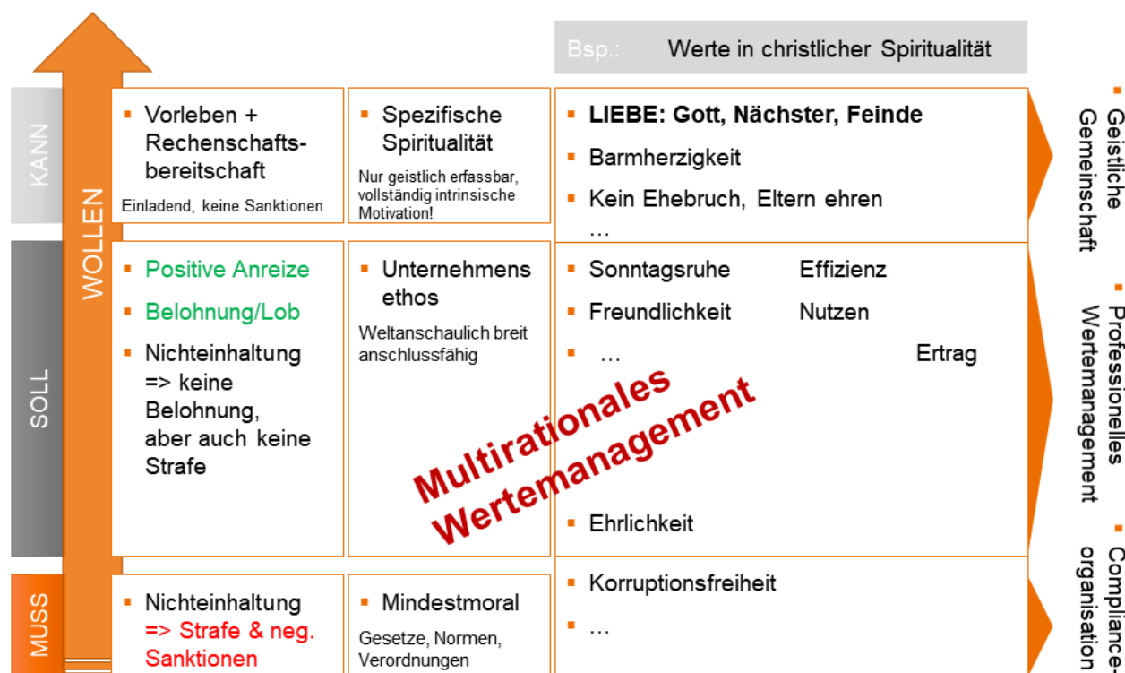
Abbildung 2: Menschliche Sinnsuche und Vielfalt im Blick: Ebenen ganzheitlichen Wertemanagements am Beispiel christlicher Wertvorstellungen

Das jeweils aus einem bestimmten Sinnsystem hervorgehende Werteset von Mitarbeiterinnen und Mitarbeitern ist eine wertvolle Ressource im Unternehmen. Ganzheitliches Wertemanagement berücksichtigt, dass vom Individuum als wichtig empfundene Werte bewusst oder unbewusst weltanschaulich fundiert sind. Damit können die Werte von einer auf die Weltanschauung bezogenen jeweils spezifischen Art der Spiritualität begleitet werden. Dieser spezifischen Form der Spiritualität wird als Ressource der werteorientierten Selbststeuerung so weit Raum gegeben, dass erwünschte Werte verstärkt werden und sich entfalten können. Im Verständnis eines ganzheitlichen und menschengerechten Wertemanagements wird darauf hingearbeitet, die im einzelnen Mitarbeiter schon angelegten Werte zu identifizieren und vor allem die für das Unternehmen besonders wichtigen Werte aktiv zur Entfaltung zu bringen und zu befördern, sowie eine zwingend vorausgesetzte Mindestmoral im Sinne von Compliance zu sichern. Ganzheitliches Wertemanagement umfasst demnach mindestens drei Ebenen, die in der Unternehmenspraxis fließend ineinander übergehen.