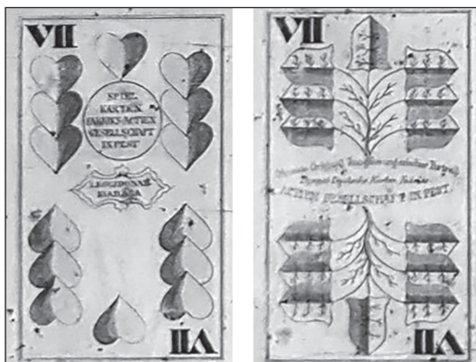
6. kép. Hazafias magyar kártyák költők és politikusok arcképével. Első Magyar Kártyagyár, 1875 k.

tyája (1860), ahol a királyok és katonai vezetők alakjai a Schwind-rajzok előképeit, a Nádasdy mauzóleum alakjait mintázzák. 38