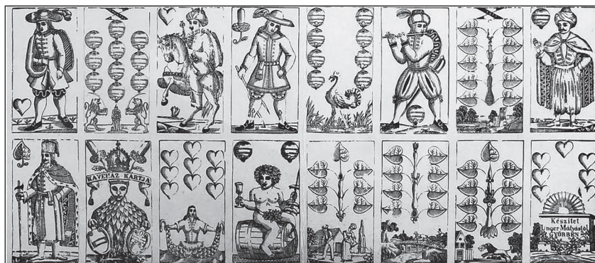
2. kép. Soproni-képes kártyák, 1850 körül, fanyomat, Rómer Flóris Művészeti és Történeti Múzeum, Győr.

A bécsi Technikai Múzeumban található három Soproni-képes pakli csak kevéssel tér el a standard képtől és más kártyakészítők ábrázolásaitól: ilyen eltérés például, hogy a tök áson Bacchus kezéből hiányzik a nyárs, illetve a makk ász oroszlánja Ausztria és Magyarország címerpajzsát tartja a kezében. 20 Fa nyomódúccal készült kártyák és kártyacsomagolók bizonyítják, hogy más soproni-képes Unger kártyák is léteztek, például 32 lapos kávéházi kártyák (2. kép). 21 Ezek sokkal jobban eltérnek a standard képtől, a figurák magyaros öltözetet viselnek, ugyanakkor fajtájukban ezek a legki-finomultabb, mesterműnek tekinthető Unger kártyák, amelyek jól tükrözik az általuk készített kártyák fejlődési útját az egyszerűbbektől az olyan művészibb kivitelű pakli-kig, mint amilyenekért az 1846-os győri iparmű kiállításon dicséretben részesültek. 22