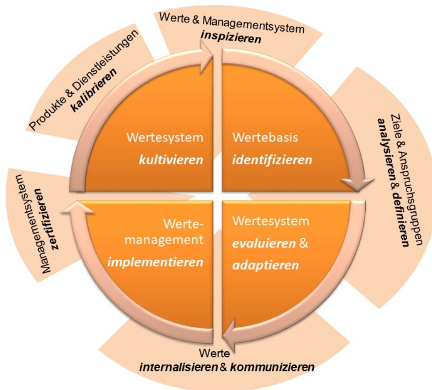
Abbildung 3: Der praxisorientierte Wertemanagementkreislauf nach Bolsinger

Zunächst gilt es, die vorhandene Wertebasis im Unternehmen zu identifizieren. Dieser Schritt wird in der Praxis allzu oft einfach übersprungen oder die Werte werden als bereits gegeben betrachtet. Im schlechtesten Fall orientiert sich das Unternehmen aufgrund des Werteverständnisses an wenigen mit Gestaltungsmacht ausgestatteten Topführungskräften und deren teilweise extern durch Marketingberatung oder Unternehmensberatung vorgeschlagenen Werten, die dann einfach als gesetzt und zielführend betrachtet werden. Ein derartiges Vorgehen bildet in der Regel nicht die Realität und damit die im Unternehmen tatsächlich vorhandenen Wertepotenziale ab, sondern führt von Anfang an in eine „Wünsch-Dir-was-Farce“, die, wenn überhaupt, dann nur zufällig mit dem tatsächlichen Werteregime im Unternehmen übereinstimmen kann.