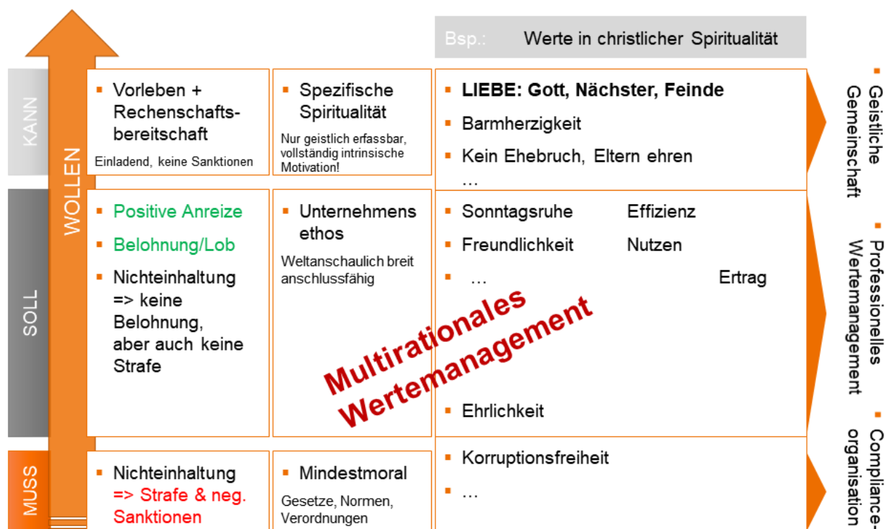
Abbildung 2: Menschliche Sinnsuche und Vielfalt im Blick: Ebenen ganzheitlichen Wertemanagements am Beispiel christlicher Wertvorstellungen

Das jeweils aus einem bestimmten Sinnsystem hervorgehende Werteset von Mitarbeiterinnen und Mitarbeitern ist eine wertvolle Ressource im Unternehmen. Ganzheitliches Wertemanagement berücksichtigt, dass vom Individuum als wichtig empfundene Werte bewusst oder unbewusst weltanschaulich fundiert sind. Damit können die Werte von einer auf die Weltanschauung bezogenen jeweils spezifischen Art der Spiritualität begleitet werden. Dieser spezifischen Form der Spiritualität wird als Ressource der wertorientierten Selbststeuerung so weit Raum gegeben, dass erwünschte Werte verstärkt werden und sich entfalten können. Im Verständnis eines ganzheitlichen und menschengerechten Wertemanagements wird darauf hingearbeitet, die im einzelnen Mitarbeiter schon angelegten Werte zu identifizieren und vor allem die für das Unternehmen besonders wichtigen Werte aktiv zur Entfaltung zu bringen und zu befördern, sowie eine zwingend vorausgesetzte Mindestmoral im Sinne von Compliance zu sichern. Ganzheitliches Wertemanagement umfasst demnach mindestens drei Ebenen, die in der Unternehmenspraxis fließend ineinander übergehen.