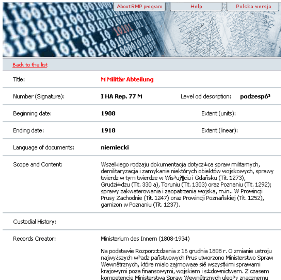
Abb. 4.1: Ausschnitt aus der Detailansicht in der Datenbank „Reconstitution of the Memory of Poland“: Der Bestand „M Militär Abteilung“ des preußischen Innenministeriums mit der Signatur I HA Rep. 77 M aus dem Geheimen Staatsarchiv Preußischer Kulturbesitz

des polnischen Alphabets in der englischen Version nicht unterstützt werden. Das ist aber allenfalls unschön, denn wer dem Polnischen mächtig ist, benutzt die polnische Version. Für Polen stellt die Datenbank eine echte Bereicherung dar und allen anderen vermittelt sie einen Eindruck, um einen Eindruck zu gewinnen, wie weit Archivgut, das Gebiete innerhalb der heutigen Staatsgrenzen Polens betreffend, in Europa verstreut ist.