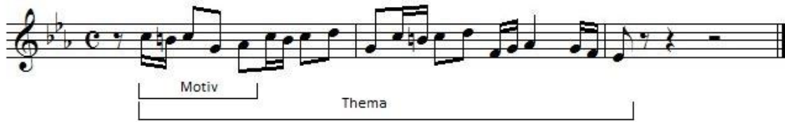
Abbildung 1: Thema der Fuge in c-Moll BWV 847 aus dem Wohltemperierten Klavier Nr. 1; komponiert von Johann Sebastian Bach 10

Thema der Fuge in c-Moll aus dem Wohltemperierten Klavier Nr. 1, in welchem die ersten fünf Töne das Motiv bilden und sich mit drei weiteren Motiven zum Thema zusammensetzen.