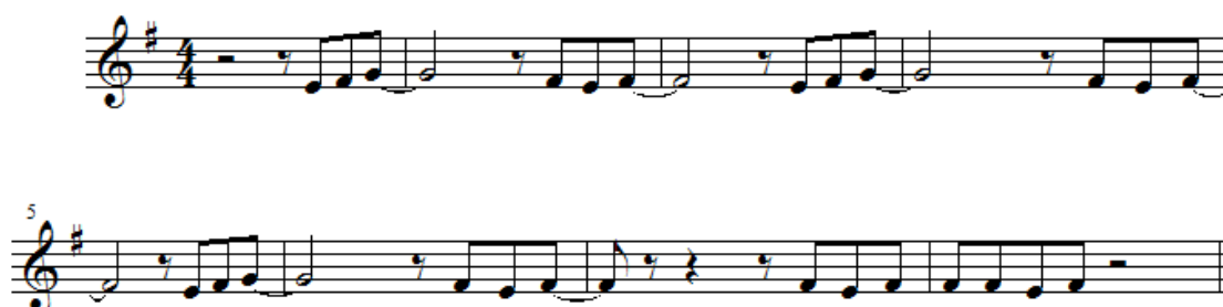
Abbildung 2: Geradeso geschützte Melodie aus dem Song "Wie ein Kind"; komponiert von Berd Plato (bürgerlicher Name: Günter Engel) 96

Im Urteil „Fantasy“ (BGH, Urteil vom 03.02.1988) wurde die Melodie von „Wie ein Kind“ (Abb. 2) auf Schutzfähigkeit überprüft.