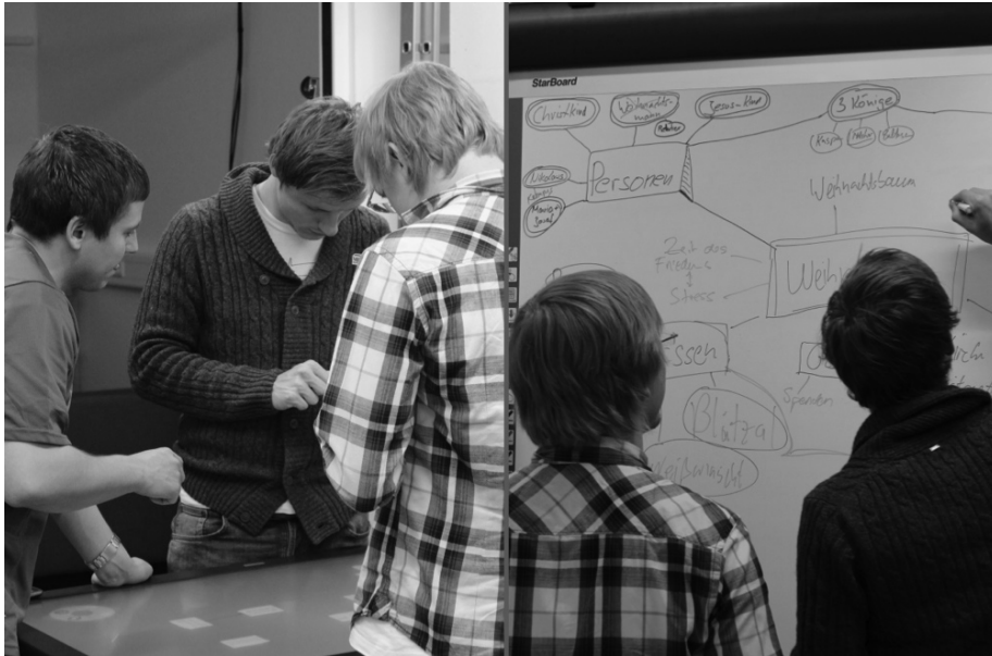
Abb. 2 Testgruppe: Links mit Tabletop, rechts am Whiteboard