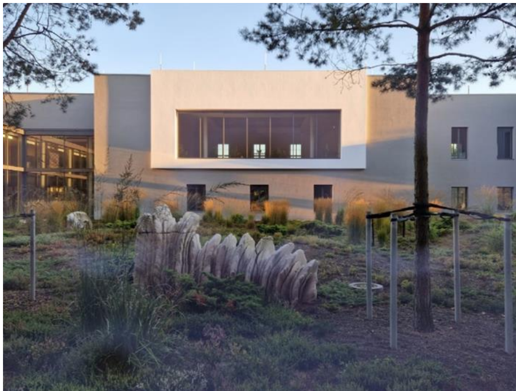
Abbildung 3: Sicht vom Foyer zum gegenüberliegenden Benutzungsbereich mit dem Mikroform- und Aktenbereich

Ausgehend vom Foyer kommen die Nutzer_innen zunächst in den Bereich der Bibliothek und des Mikroformbereichs. Diese Bereiche liegen, so wie der Empfang und die An- und Abmeldung, ebenerdig. Ein Stockwerk über der Bibliothek und dem Mikroformbereich befindet sich die Aktenausgabe und -rückgabe für die Originalakten (siehe Abbildung 3).