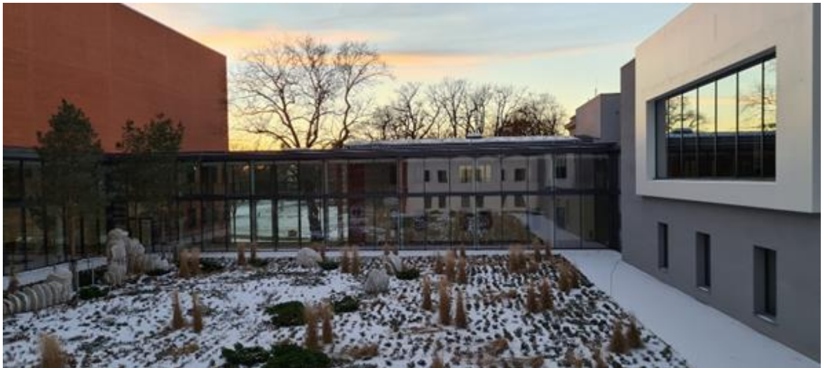
Abbildung 2: Sicht zum Foyer (linke Seite), angrenzendem Übergang für die Benutzer_innen (mittig) und Benutzungszentrum (rechte Seite), (Eigene Aufnahme, 2023)

Akten- und Mikroformbereich mit den jeweiligen Lesesälen – aufsuchen (siehe Abbildung 2).