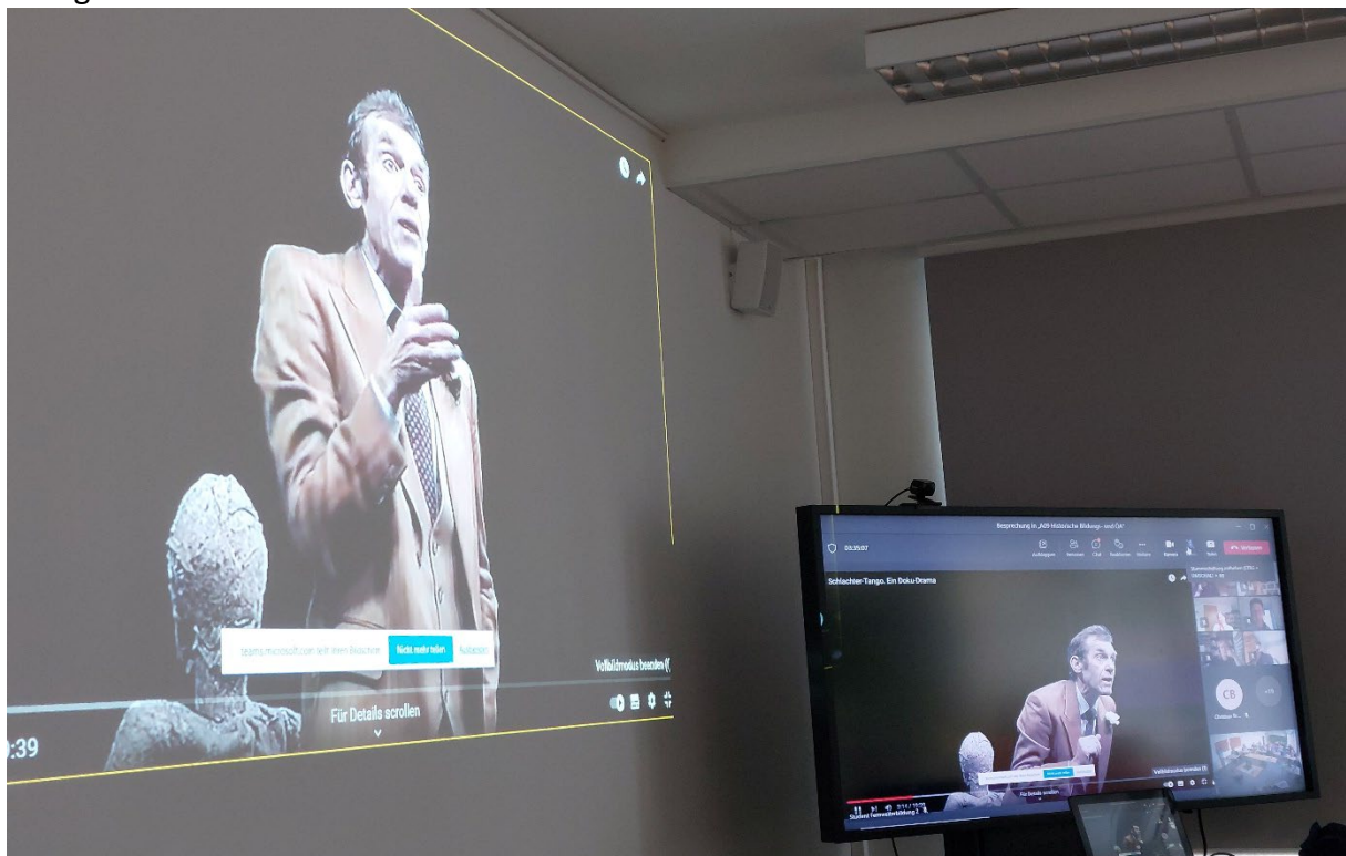
Online-Lehre über MicroSoftTeams.

Auf der Grundlage eines breiter aufgestellten Aus- und Fortbildungsangebots wäre eine zeitnahe Anpassung der Lehrinhalte mit Orientierung am Deutschen Qualifikationsrahmen Archiv xiv auf aktuelle Erfordernisse flexibler. Als Fachbereich können wir in den Studiengängen nur im Rahmen der Re-Akkreditierungsprozesse zeitverzögert reagieren, xv in dem Zertifikatsprogramm „Archive im Informationszeitalter“ sind wir in allen Bereichen, speziell auf dem Gebiet der Digitalen Langzeitarchivierung, weitaus dynamischer. Dieses könnte als Blaupause dienen, um langfristig im Sinne eines „virtuellen Weiterbildungszentrums“ den fachlich nicht einschlägig Vorgebildeten archivische Inhalte zu vermitteln. An einem solchen Programm könnte sich ortsunabhängig viele beteiligen, denn mit der Online-Lehre gibt es inzwischen genügend positive Erfahrungen. Und der Innovationsschub der digitalen Lehre wird nicht nur didaktisch, sondern auch angesichts der Energiekrise noch von Vorteil sein.