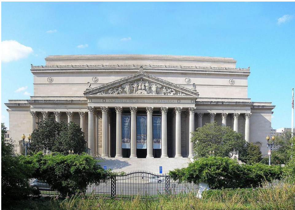
Abbildung 3: Hauptgebäude der National Archives and Records Administration (NARA) in Washington DC