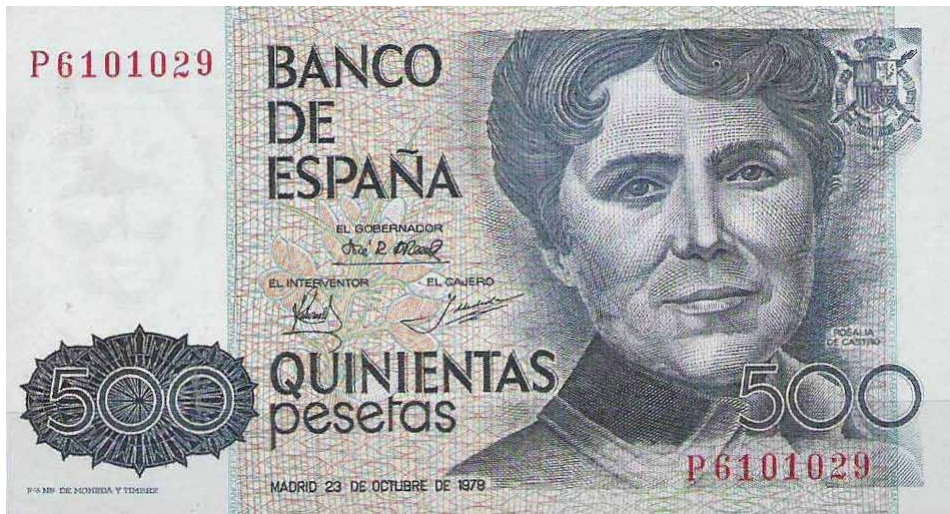
Abb. 2: 500-Peseten-Schein mit Bild Rosalía de Castros

Rosalía de Castro (* 21. Februar 1837 in Santiago de Compostela; † 15. Juli 1885 in Padrón, Galicien) finden wir auf dem 500-Peseten-Schein: