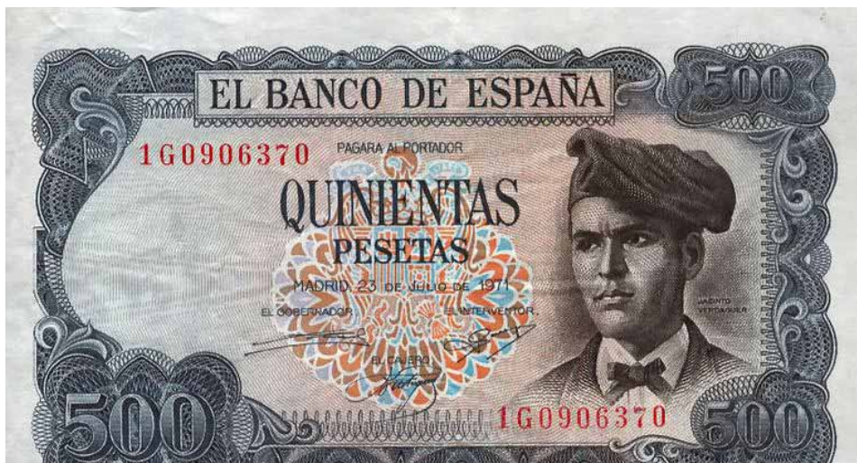
Abb. 3: 500-Peseten-Schein mit Bild Jacint Verdaguers

Jacint Verdaguer i Santaló (* 17. Mai 1845 in Folgueroles bei Vic; † 10. Juni 1902 in Barcelona) findet sich auf einer anderen Serie desselben Geldscheins: