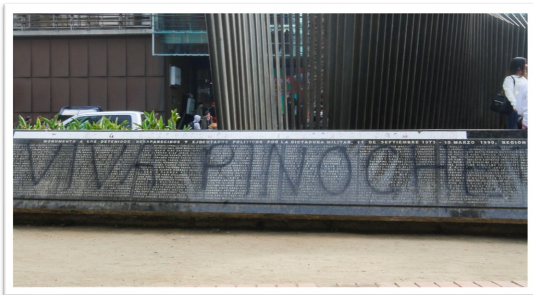
Rayado en el Monumento a Detenidos Desaparecidos y Ejecutados Políticos, en la ciudad de Valparaíso 4, 17.04.2018. Imagen 4.

El pasado nunca está terminado. Su disputa es siempre objeto de intereses políticos. Por eso se habla de una “politización”, un uso político de la memoria. En las sociedades posdictatoriales de nuestra América Latina, la reinterpretación del pasado responde a nuevas sociedades que se despliegan bajo nuevas condiciones en estos últimos 30 años, un debate cultural y político aún no resuelto y que, más aún, se complejiza con los nuevos referentes culturales de las nuevas generaciones. La batalla por la memoria no es todavía una guerra ganada por ningún grupo político.