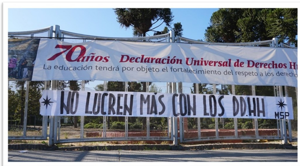
“No lucren más con los Derechos Humanos.”, 10.01.2019. 12. Imagen 5.