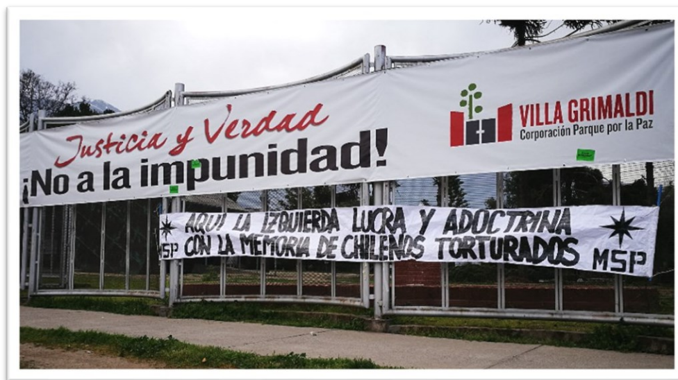
“Aquí la izquierda lucra y adoctrina con la memoria de chilenos torturados.”, 30.08.2018 13. Imagen 6.