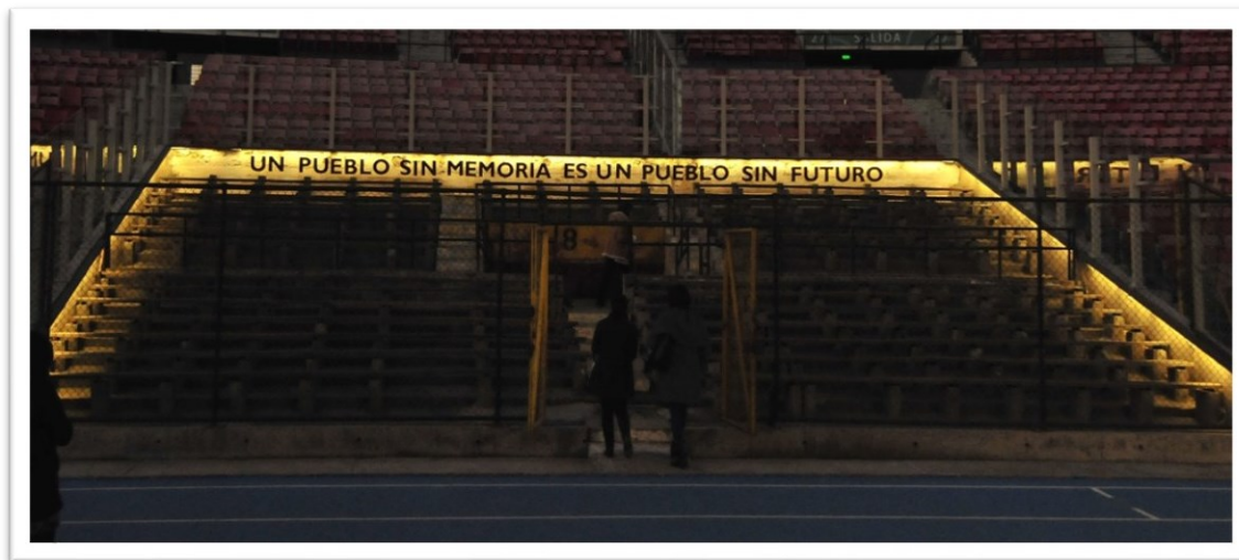
Escotilla 8 - "Graderías de la Dignidad", 2019. (Foto: Pamela Caruncho). Imagen 3.

Entre los voluntarios generalmente hay personas que hacen sus tesis o están terminando su carrera, que trabajan un año con el sitio hasta que consiguen otro trabajo y cesa su voluntariado. En el caso de uno de los entrevistados para esta investigación, contrasta el hecho de que fue decisión personal dejar su voluntariado por conflictos internos organizativos.