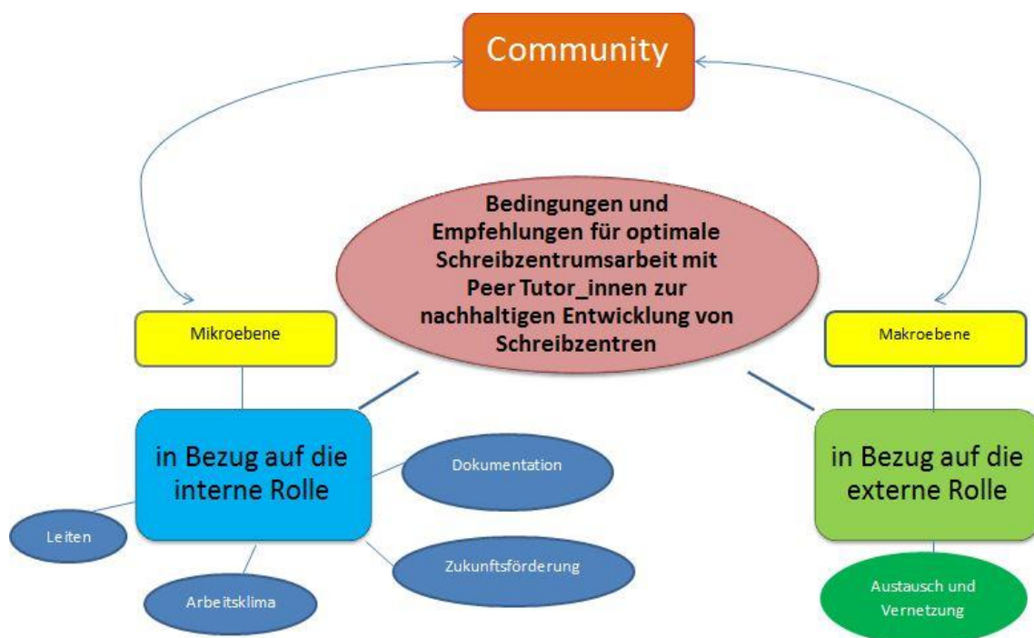
Abbildung 3: Bedingungen und Empfehlungen für optimale Schreibzentrumskarbeit mit Peer Tutor_innen.