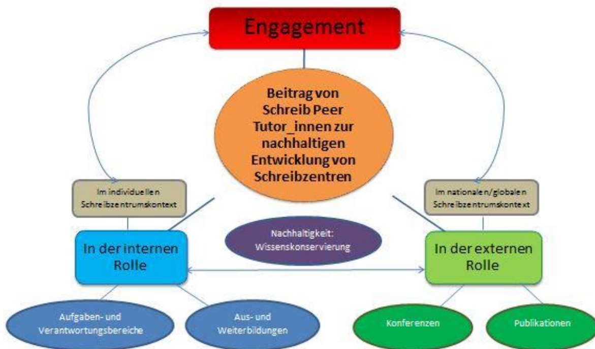
Abbildung 2: Der Beitrag von Schreib Peer Tutor_innen in der internen und externen Rolle.