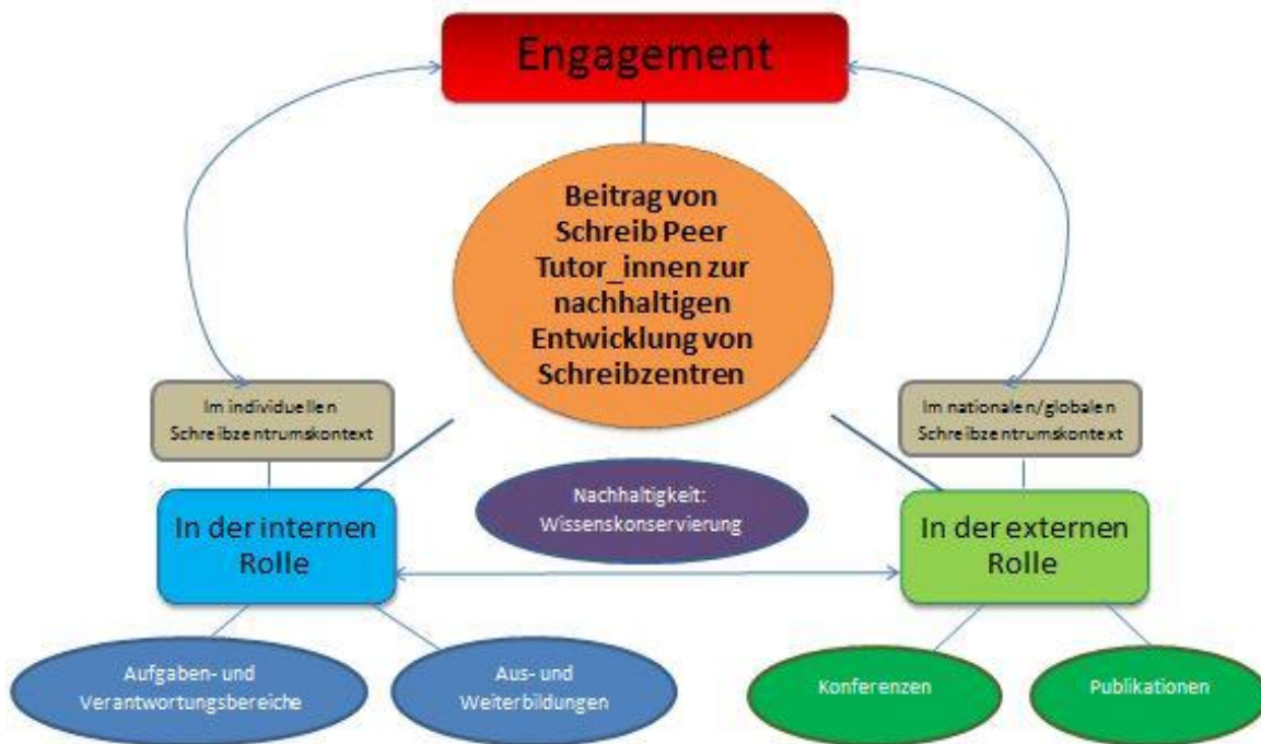
Abbildung 2: Der Beitrag von Schreib Peer Tutor_innen in der internen und externen Rolle.