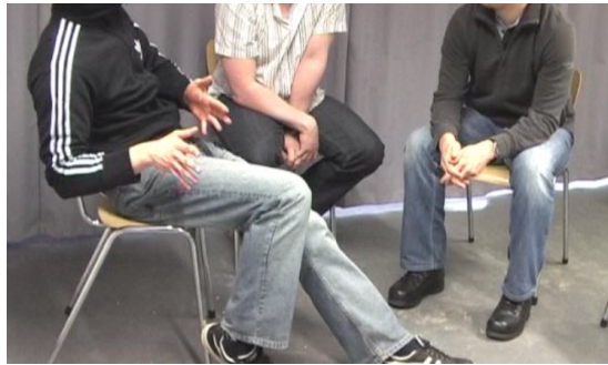
Abb. 2: Geste von A: 'Schmalspurstudium'

Unmittelbar danach ergreift A den Turn und übernimmt mit diesem die Metapher. Allerdings ist bereits an dieser Stelle zu erkennen, dass eine Umformulierung in der verbalen Modalität sowie Parametervariation in der gestischen Ausführung bezüglich des Gestenraumes stattfinden (vgl. Abbildung 2). Anstelle von Schmalspurdenken äußert A „Schmalspurstudium“ während er die entsprechende Geste (schmaler Pfad) rechts von sich auf Brusthöhe ausführt ohne ihr Pendant aufgrund der direkten Unterbrechung seitens Bs aufzugreifen.