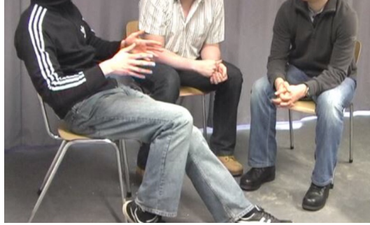
Abb. 3: Geste von A

Schmalspurstudium in dem Sinn, dass du dich nur auf eine Richtung konzentrierst= [TC:00:14:16-00:14:20]