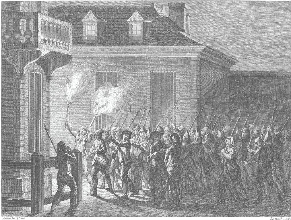
PARIS GARDÉ PAR LE PEUPLE la nuit du 12 au 13 Juillet 1789.

„PARIS BEWACHT DURCH DAS VOLK die Nacht vom 12. auf den 13. Juli 1789.“