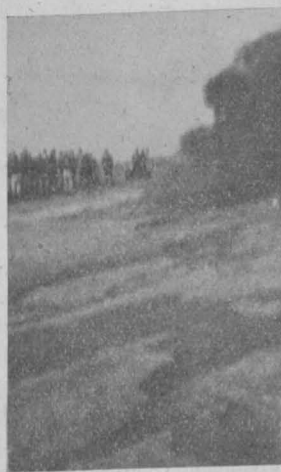
Abb. 4. III. Versuch A.

Der zweite Versuch (Abb. 2 und 3) zeigte, wie ein brennendes Lager von mit Holzwolle gefüllten Kisten und ein brennendes Teerfaß in wenigen Min. gelöscht werden kann. Selten werden sich im wirklichen Leben wie bei diesem Versuche derartig ideale Angriffsverhältnisse ergeben, noch durch bauliche Anordnung der Lagerungen zu erreichen sein. Man wird in den meisten Fällen wie bisher gewöhnlich auf den Angriff aus der Ferne auf den Brandherd angewiesen sein. Wie sich in solchen Fällen auf einem längeren Weg durch die Luft der Schaumstrahl verhält, ob er nicht vielleicht zu früh zerstiebt, wurde bei diesem Versuche nicht gezeigt. Man ersieht aus dem Bilde B des zweiten Versuches (Abb. 3), daß der Angriff aus unmittelbarer Nähe aber mit Erfolg auf den Brandherd erfolgte.