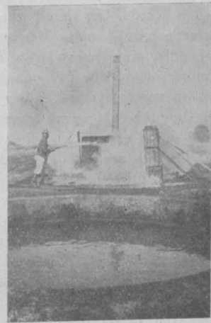
Abb. 3. II. Versuch B.

Der zweite Versuch (Abb. 2 und 3) zeigte, wie ein brennendes Lager von mit Holzwolle gefüllten Kisten und ein brennendes Teerfaß in wenigen Min. gelöscht werden kann. Selten werden sich im wirklichen Leben wie bei diesem Versuche derartig ideale Angriffsverhältnisse ergeben, noch durch bauliche Anordnung der Lagerungen zu erreichen sein. Man wird in den meisten Fällen wie bisher gewöhnlich auf den Angriff aus der Ferne auf den Brandherd angewiesen sein. Wie sich in solchen Fällen auf einem längeren Weg durch die Luft der Schaumstrahl verhält, ob er nicht vielleicht zu früh zerstiebt, wurde bei diesem Versuche nicht gezeigt. Man ersieht aus dem Bilde B des zweiten Versuches (Abb. 3), daß der Angriff aus unmittelbarer Nähe aber mit Erfolg auf den Brandherd erfolgte.