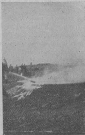
Abb. 7. IV. Versuch B.

Der vierte Versuch (Abb. 6 und 7) zeigte uns, wie erfolgreich ein brennendes Rohöllager von za. 12 m 2 freier Oberfläche gelöscht werden kann. Das Rohöl brannte mit der bekannten stark rußenden und rauchenden Flamme, die in einigen Min., nachdem die mit dem „Stanko“ ausgerüstete Schlauchlinie in Tätigkeit gesetzt worden war, bewältigt wurde. Auch hier herrschten wie früher außerordentlich günstige Verhältnisse für den Angriff auf den Brandherd. Wie früher bedeckte der Schaum nicht von selbst die brennende Oberfläche, sondern es mußte die Verteilung desselben mit dem Strahlrohr herbeigeführt werden, wie früher blieb auch eine Menge unverbranntes Lagerungsmaterial erhalten, was tatsächlich und einwandfrei bewiesen wurde.