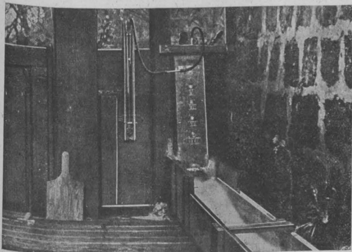
Abb. 11. Modellversuch.

Zwecks Nachprüfung der für die Berechnung und Einrichtung des Heberwehres verwendeten Unterlagen habe ich in den Jahren 1912 und 1913, unterstützt von dem örtlichen Bauleiter, zahlreiche Versuche mit zwei Modellen, von denen das kleinere im Maßstab 1:20, das größere im Maßstab 1:5 hergestellt worden ist, ausgeführt (Abb. 11). Diese Versuche sollten Aufschluß liefern: