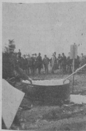
Abb. 1. I. Versuch.

Versuche, Mittel zu finden, mit welchen derartige Brände erfolgreich bekämpft werden können, sind nicht neu. Es wurden viele Naß- und Trockenlöcher erdacht, Löschverfahren festgelegt, doch keinem der neuartigen Angriffe auf solche Brandherde war bisher ein voller Erfolg beschieden. In neuester Zeit erregt das Schaumlöschverfahren die Aufmerksamkeit der Fachwelt. Dieser Art des Löschverfahrens, welches darauf ausgeht, das brennende Material mit einem ziemlich beständigen \text{CO}_2 -haltigen Schaum zu überziehen, um dadurch einen vollständigen Abschluß des brennenden Körpers von der atmosphärischen Luft herbeizuführen, die Flamme also auf diese Art zum Erlöschen zu bringen, scheint ein großer Erfolg beschieden zu sein. Die allgemeine Verwendung dieses Verfahrens scheiterte bisher daran, daß es ohne größere Vorrichtungen sehr schwer, ja unmöglich war, an beliebiger Stelle, zu jeder Zeit, in genügender Menge diesen Schaum zu erzeugen und mit demselben den brennenden Körper erfolgreich überziehen zu können. Diese Übelstände scheinen nun bei dem Verfahren, das die beiden Brandmeister der Wiener Berufsfeuerwehr Stanzer und König erdacht haben, in hohem Maße beseitigt zu sein.