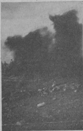
Abb. 6. IV. Versuch A.

Ich bemerke gleich an dieser Stelle, daß es eventuell in besonderen Fällen Aufgabe der Baubehörde sein kann, wenn dieses Löschverfahren ausreichend erprobt und festgelegt sein wird, auf diese Erfahrungen bei der baulichen Ausgestaltung derartiger Lager und Depoträume Rücksicht zu nehmen.