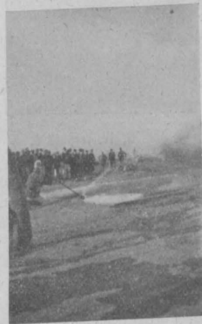
Abb. 5. III. Versuch B.

Der dritte Versuch (Abb. 4 und 5) sollte einen Brand in einer Garage vortäuschen, in welcher auf dem feuerfesten, wasserundurchlässigen Boden Benzin ausgeschüttet wurde und welches ebenfalls in Brand geraten war. Bei diesem Versuche wurde aus Beziekkannen auf die hergerichtete muldenförmige, za. 10 m 2 große Bodenfläche aus Zement das Benzin ausgeschüttet und von einem Mann der Berufsfeuerwehr in Brand gesetzt. Die mit dem „Stanko“ ausgerüstete Schlauchlinie wurde nun in Tätigkeit gebracht und der Schaum mit dem eigenartig