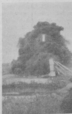
Abb. 2. II. Versuch A.

kann wie ein gewöhnlicher Wasserstrahl, allerdings nicht auf dieselbe Distanz wie der letztere, willkürlich dirigiert werden. Durch verschiedene Ausgestaltung des Strahlrohres, Anbringung von festen Rohrleitungen oder baulichen Ausgestaltungen der Lager kann den örtlichen Verhältnissen bei verschiedenen Lagerungen und den verschiedenen Zugangsmöglichkeiten zu denselben und den Eigentümlichkeiten dieses Löschverfahrens Rechnung getragen werden für den Fall, daß es sich auch in der Praxis als absolut verlässlich erweisen sollte. Bei den nun folgenden Versuchen ist festzuhalten, daß die Brandherde allseitig leicht zugänglich waren, daß man von Rauch und Hitze wegen des herrschenden starken Windes wenig belästigt wurde, sonach die Wirkung des Schaumstrahles genau beobachten und regeln konnte.