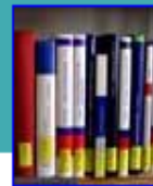
A - Z