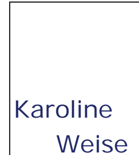
Karoline Weise (ZBW Kiel)