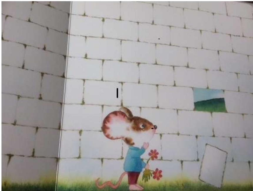
Illustration urheberrechtlich geschützt, Nutzung für Vortrag und Online-Dokumentation mit freundlicher Genehmigung des Verlags