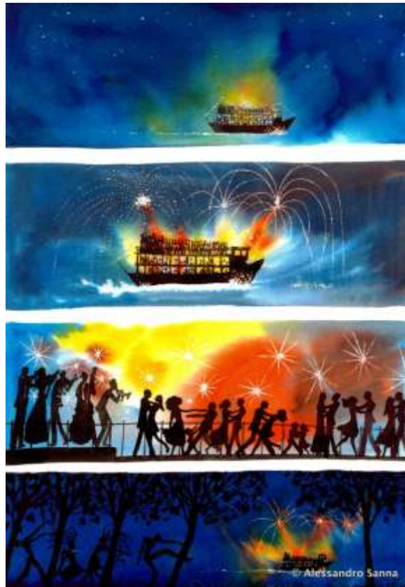
Illustration urheberrechtlich geschützt, Nutzung für Vortrag und Online-Dokumentation mit freundlicher Genehmigung des Verlags