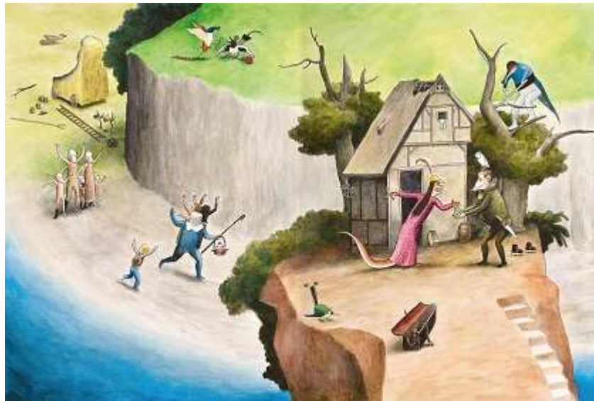
Illustration urheberrechtlich geschützt, Nutzung für Vortrag und Online-Dokumentation mit freundlicher Genehmigung des Verlags