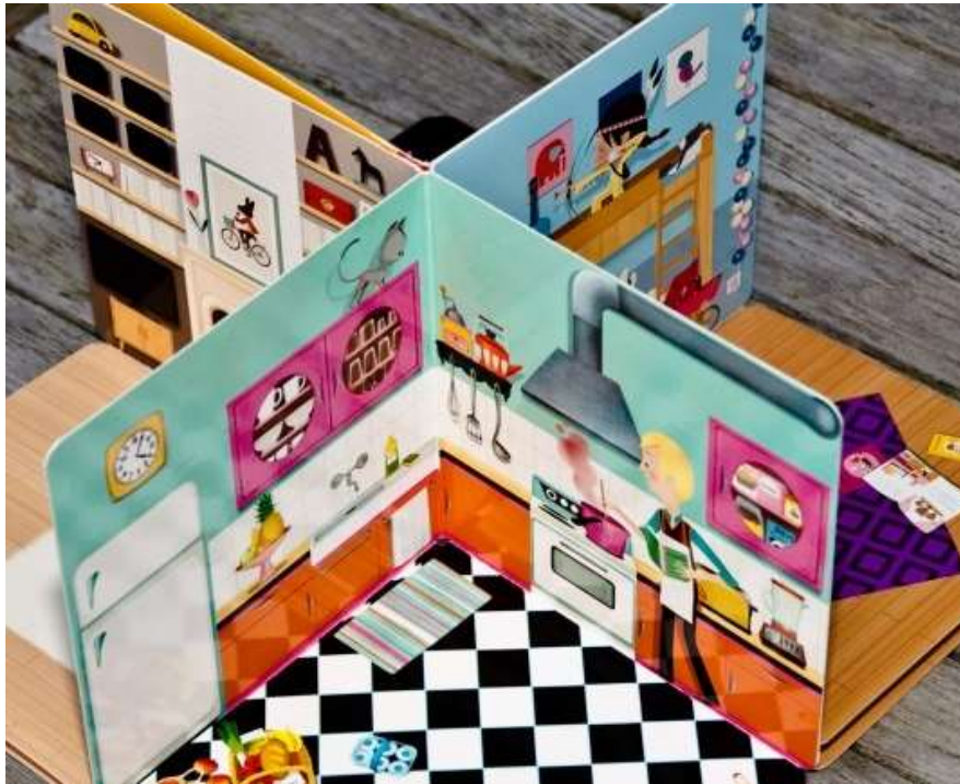
Illustration urheberrechtlich geschützt, c Beltz & Gelberg