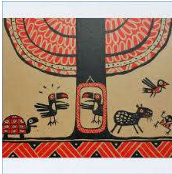
Illustration urheberrechtlich geschützt, Nutzung Vortrag und Online-Dokumentation mit freundlicher Genehmigung des Verlags