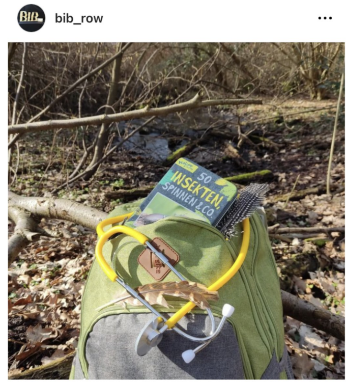
Gefällt 17 Mal bib_row Es geht wieder in die Natur! 🌱🌞🍷 Mit dem Entdeckerrucksack gehen unsere RoOKi, also unsere Rotenburger Outdoor Kids, am 9. März ab 16 Uhr wieder auf Forschungsreise. Kinder ab 6 Jahren

Instagram: @stadtuecherei_laatzten Instagram: @bib_row