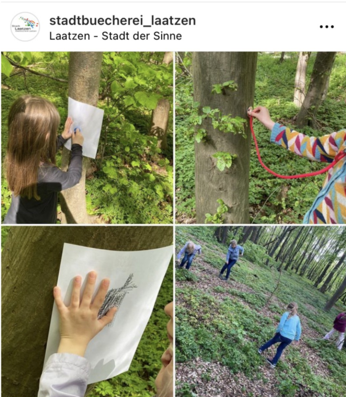
Gefällt 31 Mal stadtuecherei_laatzten Heute ging es raus in den Wald - um zu entdecken, zu erkunden und zu

Instagram: @stadtuecherei_laatzten Instagram: @bib_row