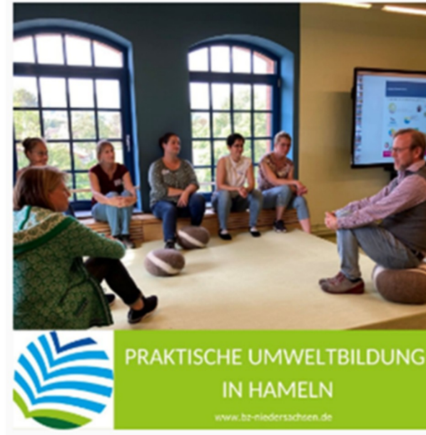
PRAKTISCHE UMWELTBILDUNG IN HAMELN