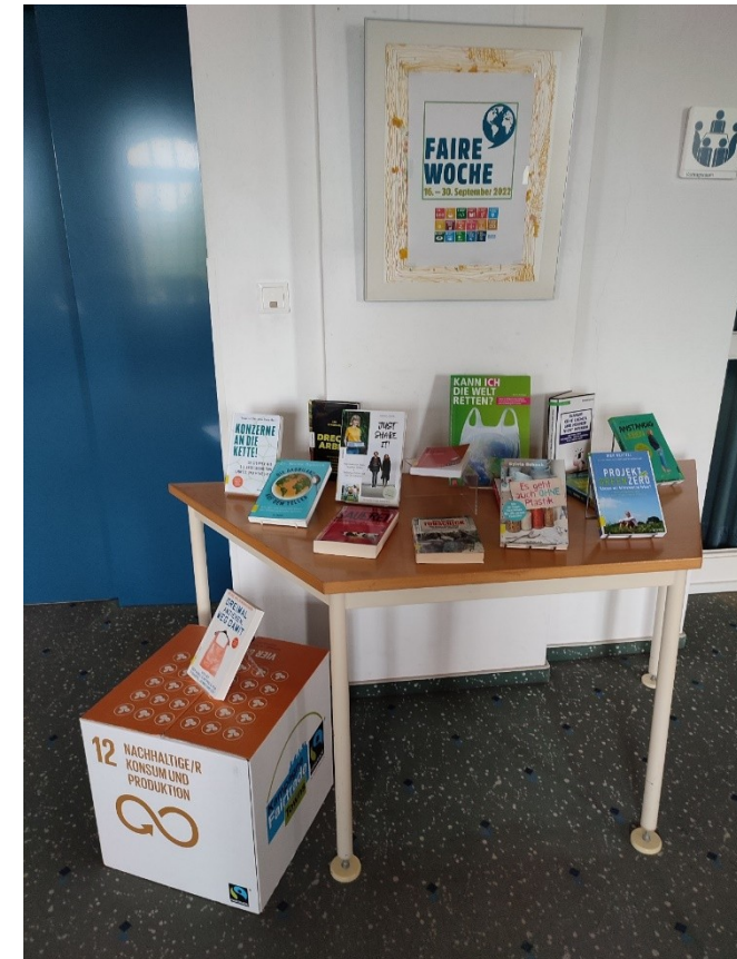
Präsentation im Grünen Labor Hameln