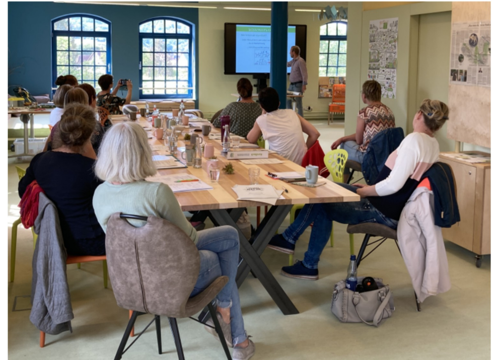
© Büchereizentrale Niedersachsen, Umweltbildung mit dem SCHUBZ Lüneburg