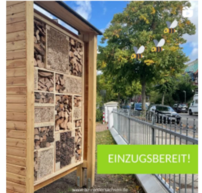
Insektenhotel (NABU, Lebenshilfe)