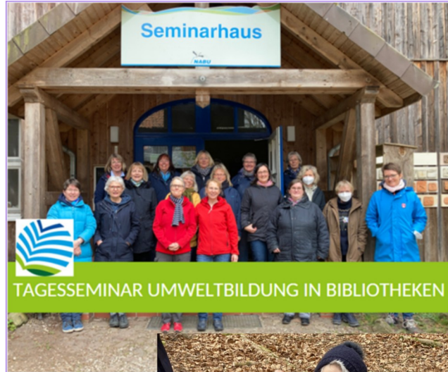
TAGESSEMINAR UMWELTBILDUNG IN BIBLIOTHEKEN