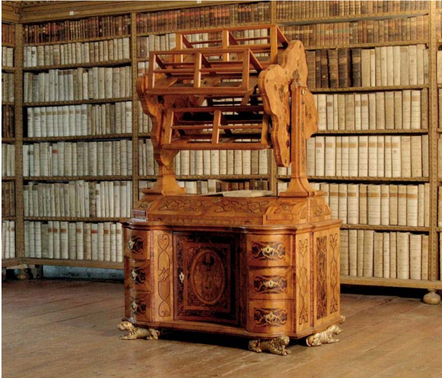
Bücherrad im Benediktinerstift Lambach

aufgegeben 5 . Die neuen Bücherrepositorien an den Wänden, in denen man ein Buch nach Gebrauch deponierte, bedingten in der Bibliothek die Trennung von Lagerung und Leseplatz. Die Suche nach dem optimalen Bibliotheksmöbel führte zu durchaus bemerkenswerten Erfindungen, wie etwa dem Bücherrad, das in der Bibliothek des Benediktinerstifts Lambach verwendet wurde: