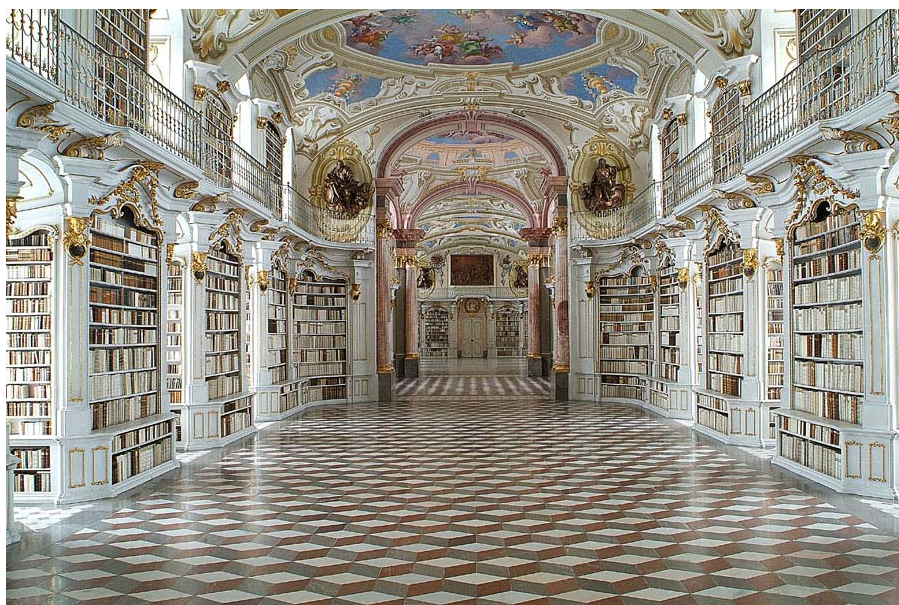
Bibliothek des Benediktinerstifts Admont

In populären Medien wie Wandkalendern oder Wikipedia-Artikeln wird die Bibliothek des österreichischen Benediktinerstifts Admont gerne mit Superlativen beschrieben: Man zählt sie zu den „schönsten Bibliotheken der Welt“ 1 oder heißt sie die „größte Klosterbibliothek der Welt“ 2 .