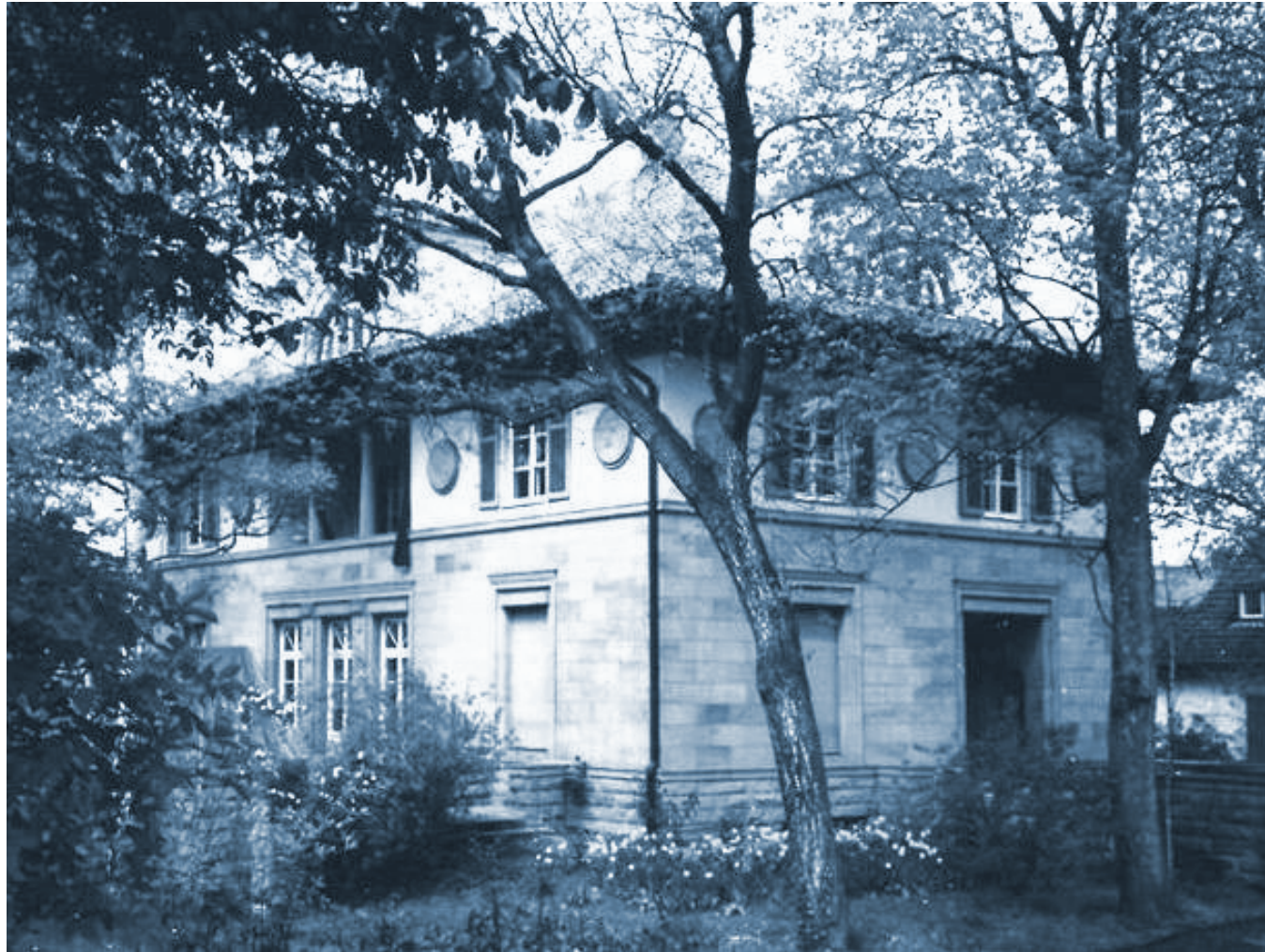
Hauptgebäude des dfi in Ludwigsburg