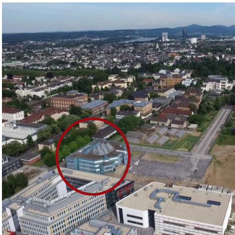
Universität Bonn, Naturwiss.Campus