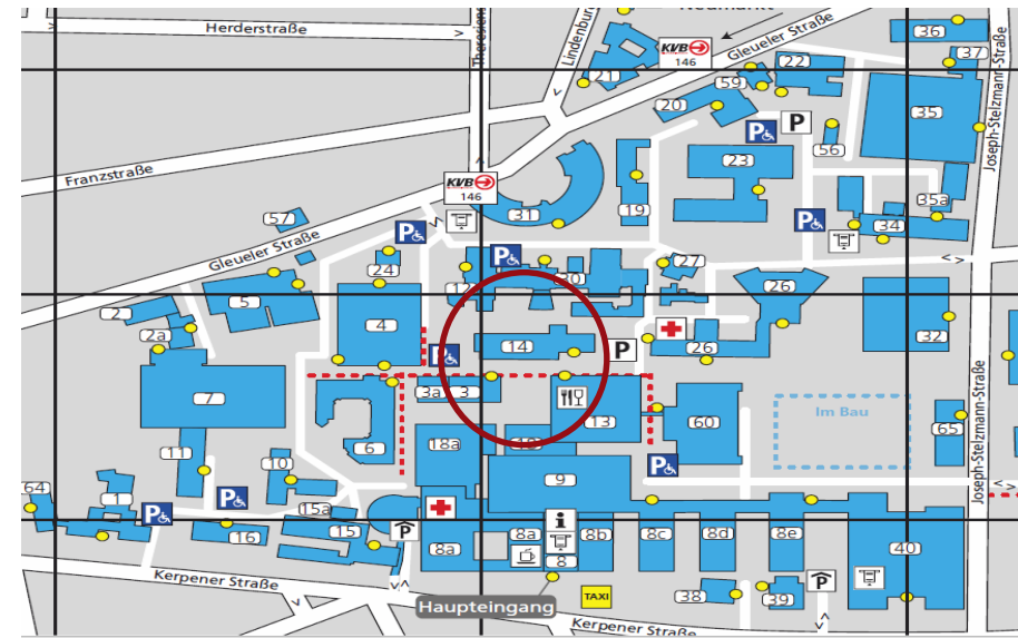
Universität Köln, Uniklinik/Med.Fakultät