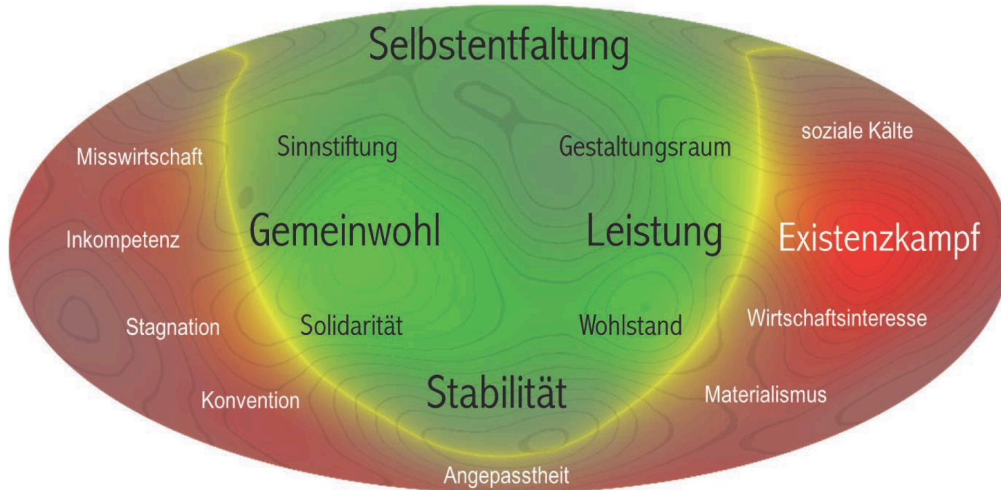
Abbildung 3: Mollweide-Projektion der Multi-ESA für den Kulturraum mit Begrifflichkeiten zur Beschreibung der Raumecken im positiven und negativen Bereich (n=1000).