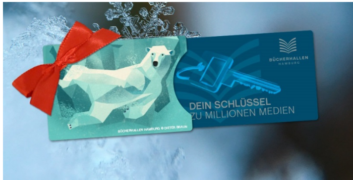
Kartenhüllen als give-away