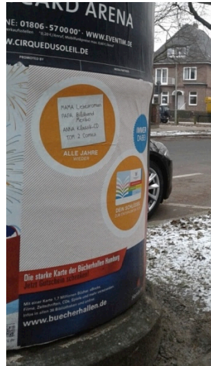
Plakat auf Litfaßsäule