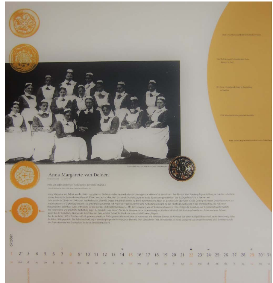
„Historische Personen in der Pflege“ Kalender 2006