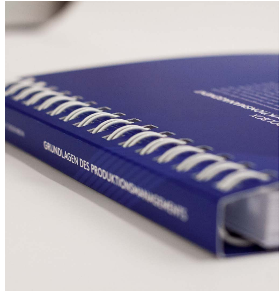
Ralf Ziegenbein: „Grundlagen des Produktionsmanagements“