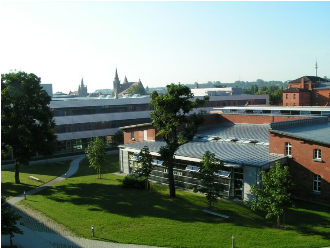
Abb.1: Die 1996 gegründete Fachhochschule Ansbach mit der Bibliothek im Zentrum

Informationskompetenzvermittlung ist machbar. Die curriculare Verankerung und damit der Zwang für Studierende, dieses Angebot tatsächlich auch anzunehmen, befördert die Informationskompetenzvermittlung. Die Auftraggeber solcher Lehrveranstaltungen werden aber nur dann einer Verstärkung des bibliotheksorientierten Lehrangebotes zustimmen, wenn dauerhaft diese verpflichtenden Veranstaltungen als Notwendigkeit und Bereicherung empfunden werden. Damit steht der Dienstleister Bibliothekar (verstanden als Frau oder Mann, jedweder Laufbahn und jedweder persönlicher Ausrichtung) in der Pflicht gegenüber Fakultäten wie auch Studierenden, aus dem Mut zum Zwang wird der Zwang zum Erfolg.