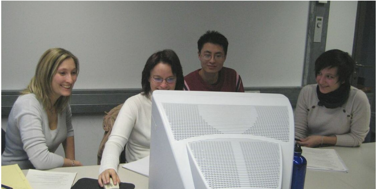
Abb.2: Entspannte Lernsituationen in der aktivierten Gruppe als didaktisches Ziel

Nicht nur Studierende entscheiden durch verschiedene Formen der Evaluation über die Dauerhaftigkeit von Lehrangeboten mit, auch die in den Studiengängen beteiligten Professorinnen und Professoren sind immer wieder von der Sinnhaftigkeit einer nebenamtlichen bibliothekarischen Lehrtätigkeit zu überzeugen. Studierende, Lehrende und Hochschulleitung müssen aus deren – durchaus auch divergierender – Interessenlage immer wieder als Unterstützer für die Aufrechterhaltung des Angebotes gewonnen werden.