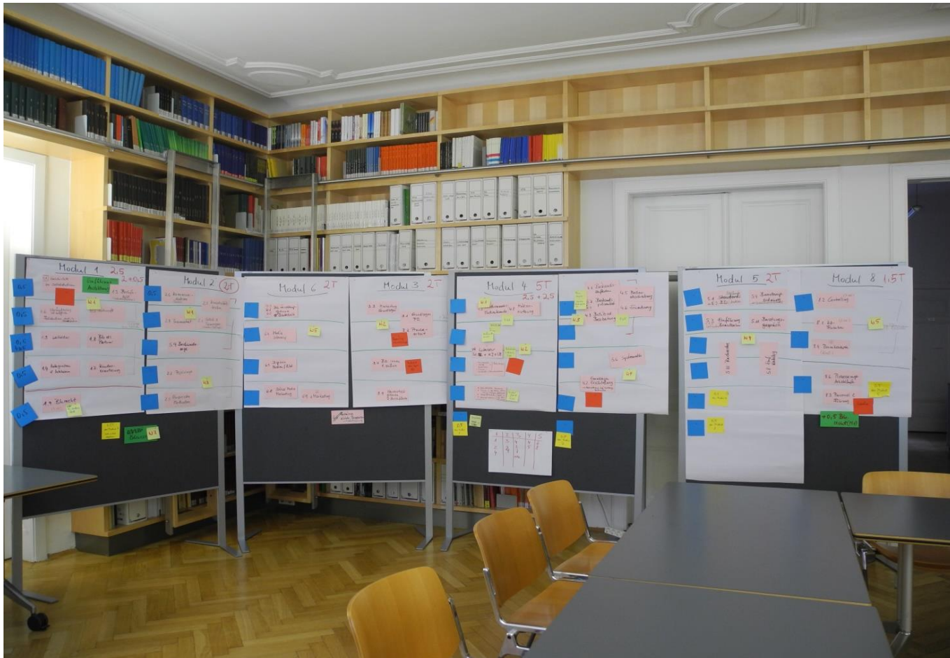
Einteilung der acht Module