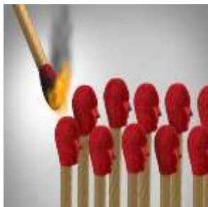
Das Erstarben des Nationalismus und Populismus The Re-Restrengthening of Nationalism and Populism