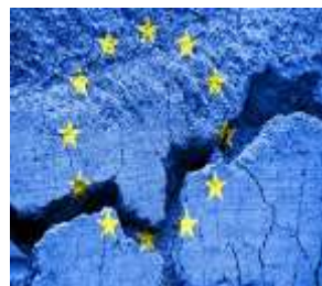
Europäische Integration und der Aufstieg national-populistischer Parteien European Integration and the Rise of National Populist Parties