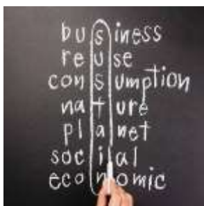
Ein 'Anstoß' zum Nachhaltigen Konsum Nudging Sustainable Consumption