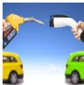
Förderung von Elektromobilität Promoting Electric Mobility