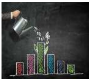
Nationale Innovationsstrategien National Innovation Strategies