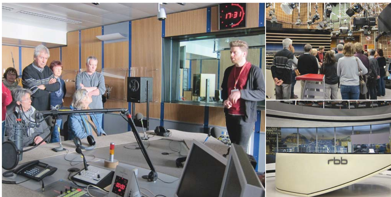
Spannende Blicke hinter die Kulissen: Die BIB-Landesgruppe Brandenburg besuchte den Rundfunk Berlin-Brandenburg (RBB).