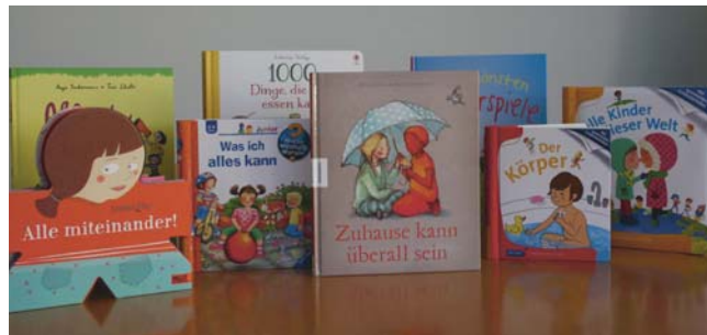
Das Vermitteln von Sprachkompetenz ist ein wichtiger Baustein bei der Integration von Flüchtlingen in die deutsche Gesellschaft: Die Stadtbibliothek Dresden unterhält daher vier Medienboxen mit jeweils etwa 25 Büchern.

Chevy wurde in den Bibliotheken Dresden-Gorbitz und Neustadt gezeigt. Sie beinhaltet Portraitfotos Asylsuchender, die durch Texte zu Vita und den ganz persönlichen Beweggründen der Flucht ergänzt werden. Während dieser Veranstaltungen kamen Dresdner mit Zuwanderern ins Gespräch, informierten sich über fremdsprachige Literatur und lernten andere Kulturen und ihre Feste kennen.