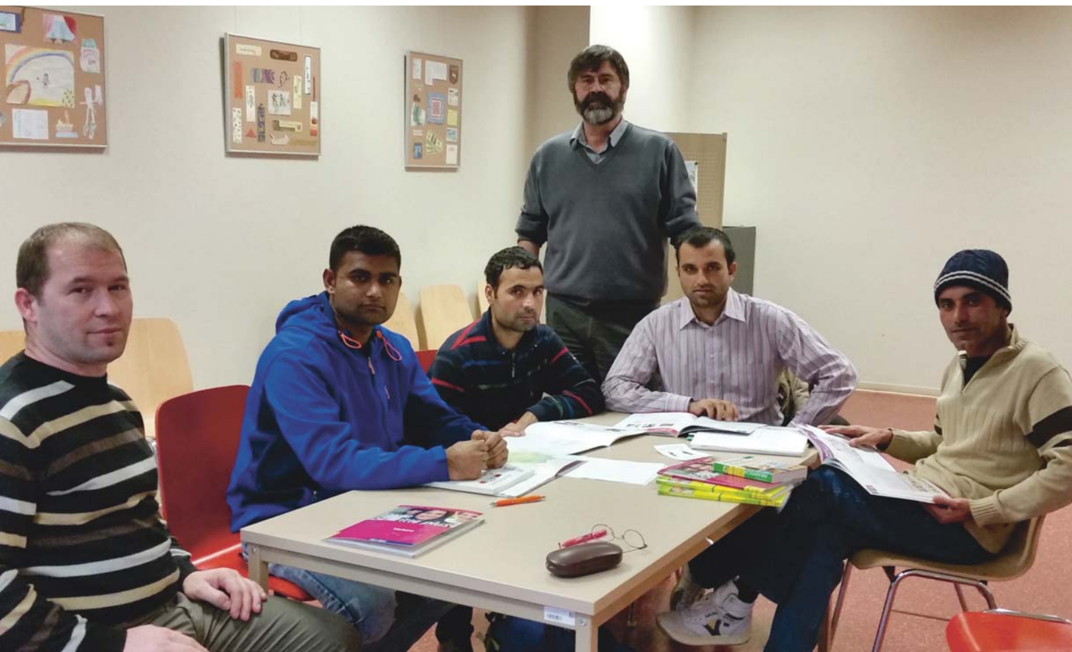
Sprachkurse wie hier in der Bibliothek Dresden-Neustadt sollen Flüchtlingen bei der Integration helfen.