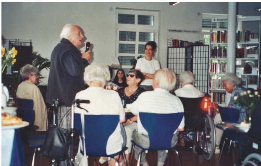
»Abholende« Bibliotheksarbeit in den 90er-Jahren in der ÖB-Zweigstelle Stuttgart-Stammheim. Studierende bereiteten Literatur und Gespräche vor.