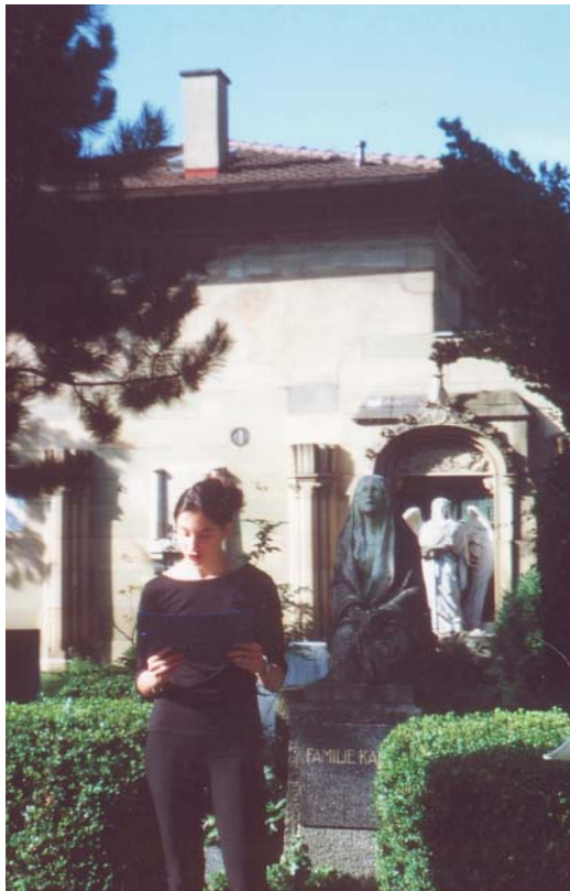
Der Stuttgarter Pragfriedhof war eine gute Kulisse für so manchen Literaturspaziergang in den 90er-Jahren.

Literaturvermittlung mit kreativen Mitteln ist bis heute mein liebster Schwerpunkt. Dabei kamen bei den Literaturspaziergängen auch »ungewöhnliche Orte« zum Einsatz, wie der Pragfriedhof oder der chinesische Garten in Stuttgart. Alte, rechtfreie Kinderliteratur über Stuttgart werteten wir aus und machten schon 1998 mit Beispieltexten für die virtuelle Kinderbibliothek »Chilias« ein Stadtspiel daraus, in dem »Kufior« (kleines unbekanntes Fluginsekt ohne Raumschiff) zu verschiedenen Orten in Stuttgart führte. Diesen virtuellen Spaziergang zu aktualisieren und für das Smartphone zu richten, das hätte ich noch gerne einmal umgesetzt!