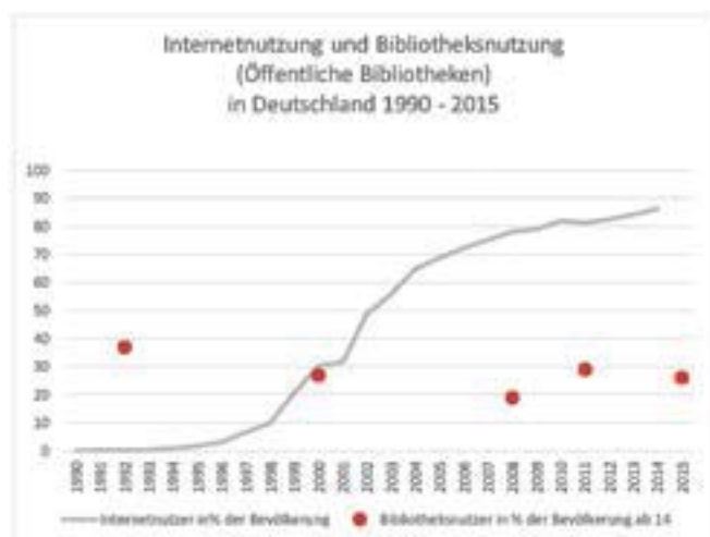
Abbildung 3: Internetnutzung und Bibliotheksnutzung (Öffentliche Bibliotheken) in Deutschland 1990 – 2015. Eigene Darstellung. Datenquellen: Internetnutzer in % der Bevölkerung: World Bank (2015), Bibliotheksnutzer: 1992 und 2000: Stiftung Lesen (2001), S. 278; 2008: Stiftung Lesen (2008), S. 188, 2011: Deutscher Bibliotheksverband / Stiftung Lesen (2012), S. 9; 2015: IfD (2015), S. 6

Wenn man bedenkt, wie stark sich das mediale und informationstechnische Umfeld der Bibliotheken in den vergangenen 25 Jahren verändert hat und wie häufig und lautstark das Ende des Buches und der Bibliotheken in den letzten Jahren beschworen wurde, dann sind die Bibliotheken – so zeigt es diese Studie – daraus bisher bemerkenswert unbeschädigt hervorgegangen. Vielleicht hält der digitale Wandel noch eine große, lebensbedrohliche Krise für Bibliotheken bereit – aber in den ersten 20 Jahren des Internets ist sie jedenfalls nicht eingetreten. Fast 60 Prozent der NutzerInnen bringen den Bibliotheken ein grundsätzliches Wohlwollen entgegen. Eine soziale und bildungszentrierte Ausrichtung der Bibliotheken bewerten sie tendenziell höher als ihre Rolle als politisch-gesellschaftliche Akteurin. Die Eckpfeiler der Bibliotheksarbeit, ein gutes Medienangebot an einem angenehmen Ort mit kompetentem Personal, sind in