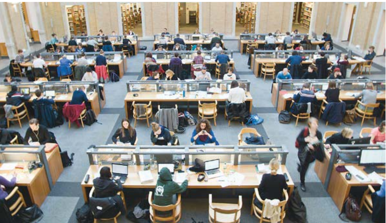
Das Konzept von PDA print wurde an der UB Leipzig entwickelt und erfolgreich umgesetzt.