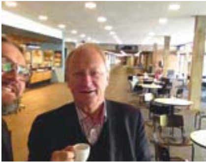
Auf einen Espresso mit Klaus Staeck.

Bibliotheken sind Orte der geballten Neugierde auf das Andere. Das sagt der langjährige Präsident der Akademie der Künste Berlin, Klaus Staeck. Als Plakatkünstler ist er unserer Branche vor allem durch das Zitat »Bibliotheken sind eine gefährliche Brutstätte des Geistes« bekannt.