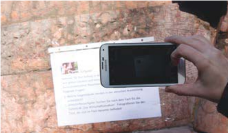
An den Stationen und Kontrollpunkten der Smartphone-Rallye mussten die Schülerinnen Fotos machen. Niemand sollte abkürzen können.

der Zentralbibliothek. Hier empfing sie das Fachpersonal und führte sie zur Auswertung in einen separaten Raum. Während sich die Schülerinnen den optimalen Lösungsweg auf einem Plakat anschauen konnten, glichen die Auszubildenden der Universitätsbibliothek (UB) Kaiserslautern die Reihenfolge der Bilder und die richtigen Lösungen ab und stellten selbstentworfenen Urkunden mit der erreichten Punktzahl aus. Als besonderes Schmankerl erhielten alle Teilnehmerinnen einen farbigen Notizblock, der in der hauseigenen Buchbinderei hergestellt wurde und für die Ausbildung in der Universitätsbibliothek wirbt.