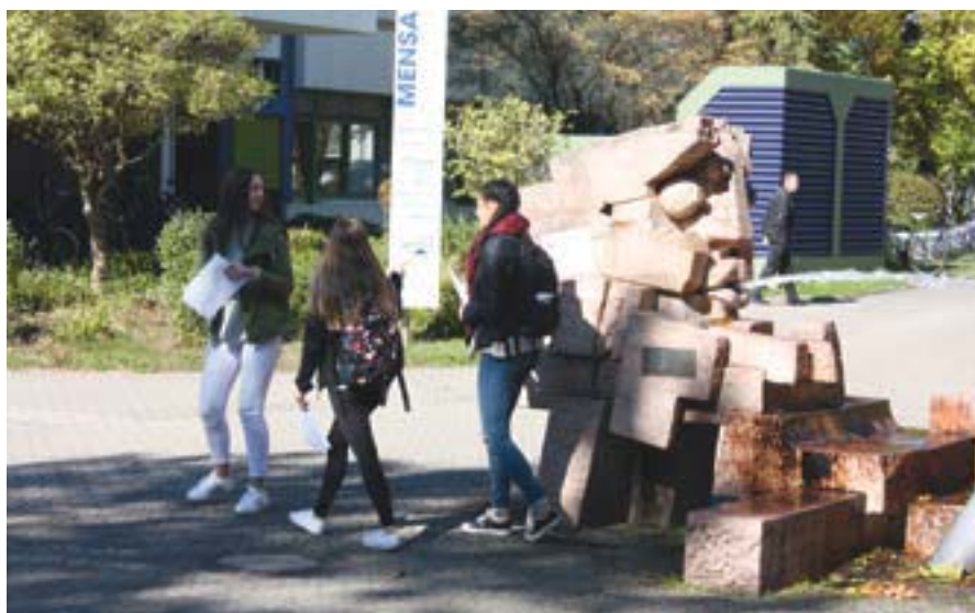
Mit dem Smartphone quer über den Campus ging es für die Schülerinnen der Klassen 10 bis 13 am Schülerinnentag an der TU Kaiserslautern. Fotos: privat

Dabei gelangten sie auf ihrem Weg in mehrere Bereichsbibliotheken, in denen Orientierungs- und Rechercheaufgaben gelöst werden sollten. Für die Aufgaben gab es je nach Schwierigkeitsgrad unterschiedliche Punkte. Sie waren so gestellt, dass sie durch einen Schnappschuss gelöst werden konnten. Um auf den Weg zurückzukehren, gingen die Schülerinnen an den Punkt zurück, an dem sie ihn zuletzt verlassen hatten und hielten nach dem nächsten Objekt Ausschau. Manches Mal gelangten sie