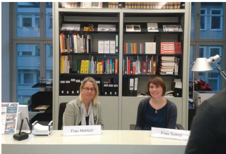
Die Kolleginnen vom Auskunftspunkt stehen den Benutzerinnen und Benutzern mit Rat und Tat zur Seite.