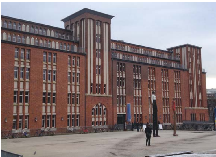
Mit etwa 500000 Medien ist die Zentralbibliothek, liebevoll »Hühnerposten« genannt, die größte Einrichtung der Hamburger Bücherhallen.

Wie erwähnt, es war diese Bibliothek hier, die mir die nötige Musikinspiration gab, also ein kleines Zeichen meiner Dankbarkeit an diesen Ort. Und eben auch, weil ich diesem etwas verklärten Bild des Musikers mit seiner Flasche Rotwein oder Whiskey, wie er da nächtelang an seinem Piano oder seiner Gitarre sitzt, etwas entgegensetzen wollte. Denn es geht ganz einfach, man geht in diese Bibliothek, holt sich das ganze Zeug und kann somit auch viel