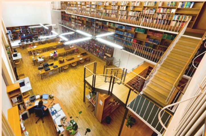
Blick in den Lesesaal Musik der Bayerischen Staatsbibliothek.

Musikhochschulbibliotheken verstehen sich als zentrale Lernorte ihrer jeweiligen Institution. Sie unterstützen ihre