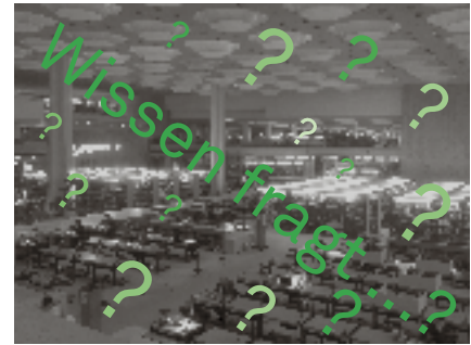
Staatsbibliothek zu Berlin

Lichtverhältnisse bestehen. Die Bibliothek erhielt bei ihrem Umbau einen kleinen Innenhof, ein Atrium mit Glaskuppel, durch die tolles Licht hineinkommt. Wenn man an den Arbeitsplätzen entlang der Brüstungen dieses Innenhofs sitzt, guckt man in dieses tolle Licht, schaut quasi in den Himmel und kann die anderen Kollegen da und da arbeiten sehen und ist dennoch für sich.