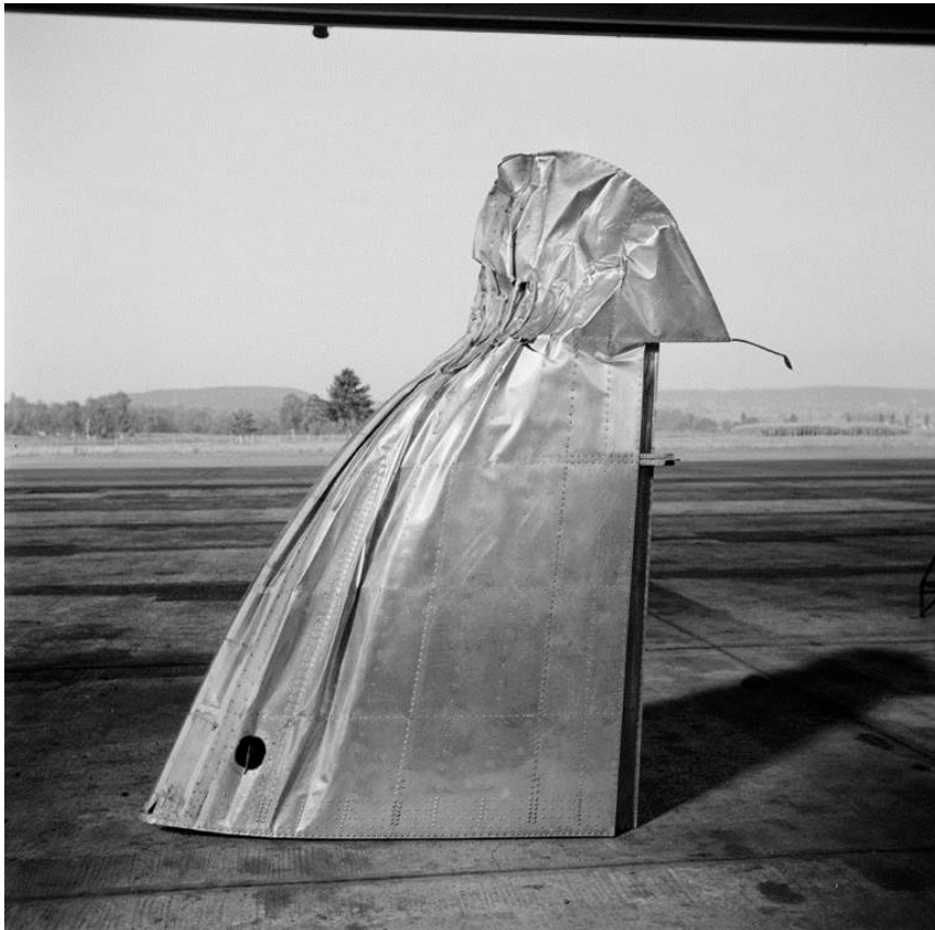
Ohne Titel Neu: Beschädigter Randbogen (Flügelspitze), auf dem Boden stehend, 1940er-Jahre